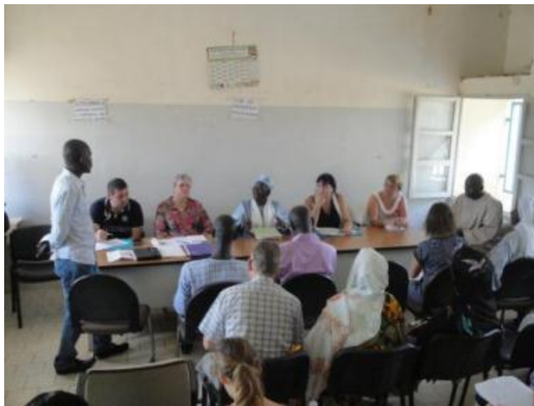
Comité de pilotage du 23 octobre 2013