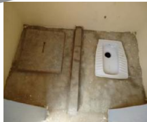
Latrine double fosse