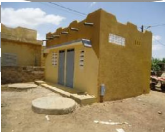
Edicule public du marché