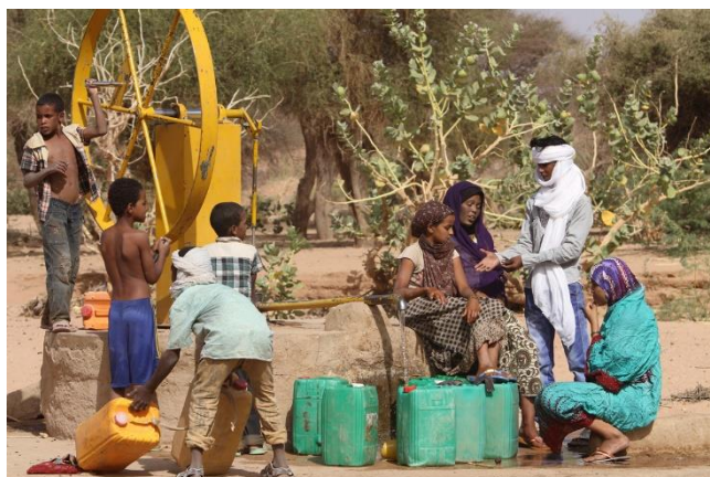
Les Puits du Désert