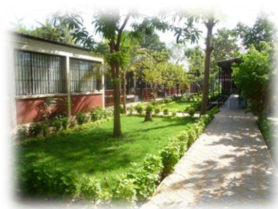
Vue d'ensemble du CEMEAU

Créé en 2009 pour prendre en compte le renforcement des capacités des acteurs de la décentralisation, notamment ceux du secteur eau potable et assainissement, le Centre des Métiers de l'Eau (CEMEAU) est aujourd'hui un outil de renforcement des capacités de ces acteurs au Burkina Faso et de la sous-région ouest-africaine.