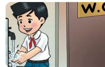
Sau khi đi vệ sinh