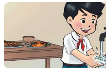
Trước khi ăn