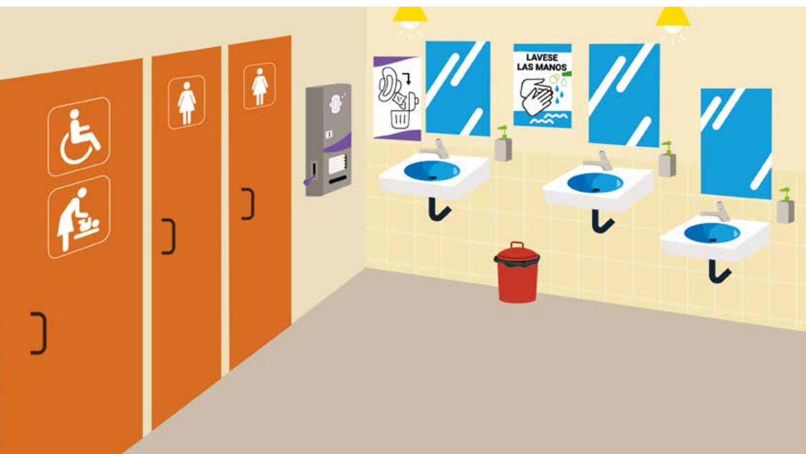
Figura 2: Ejemplo del interior de un bloque de baños adaptados a las mujeres.