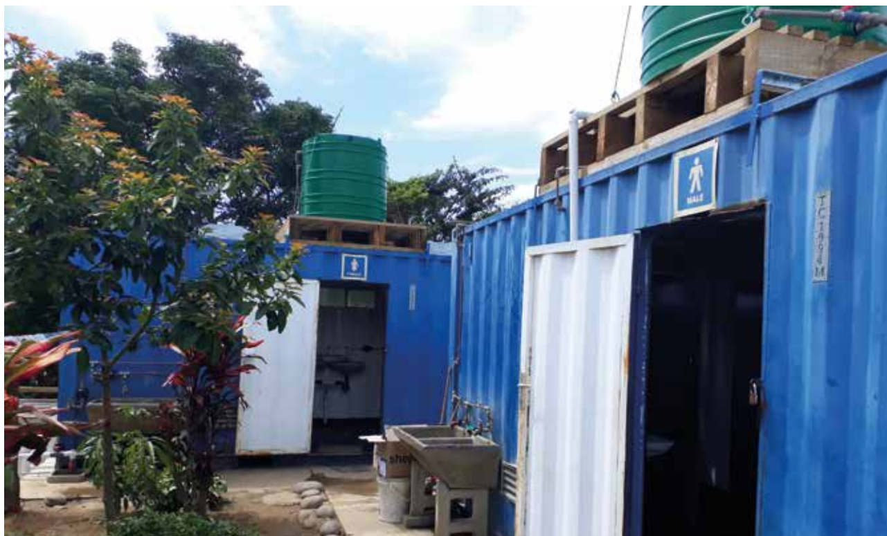
Figura 6: Baños comunitarios en Durban, Sudáfrica.

En Durban decidieron utilizar la asignación del presupuesto nacional de Sudáfrica destinado para saneamiento doméstico para pagarle a limpiadores y a encargados del aseo de medio tiempo y permitirles a las comunidades que utilizaran los baños comunitarios de manera gratuita. En Durban se instalaron más de 2,500 contenedores comunitarios, a un costo aproximado de US$ 65,000 cada contenedor. Estos permanecen abiertos las 24 horas del día en más de 500 asentamientos informales, atendiendo así a más de 1 millón de personas.