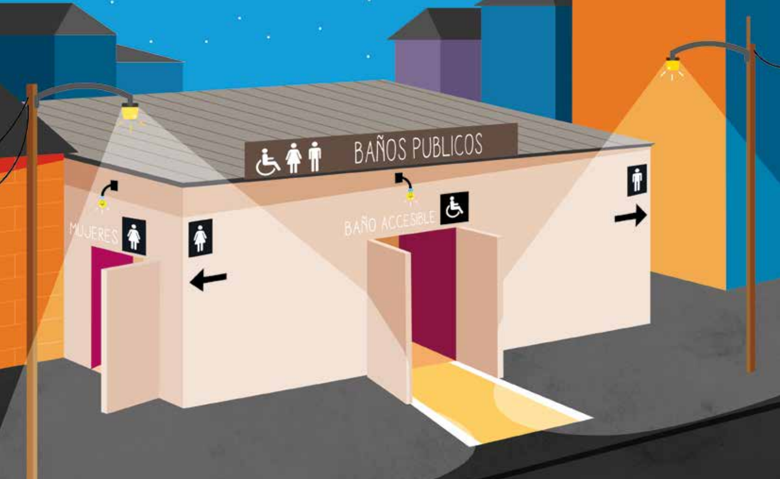
Figura 1: Ejemplo del exterior de un bloque de baños adaptados a las mujeres.