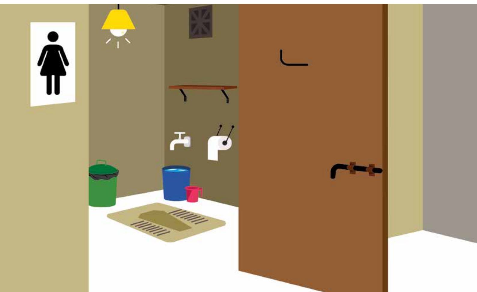
Figura 3: Ejemplo del interior de un cubículo de baño adaptado a las necesidades de las mujeres.