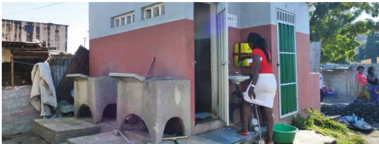
Un bloque de saneamiento comunal en Chamanculo, Maputo, Mozambique.

El Comité de gestión de bloques de saneamiento en Maputo, integrado por cinco representantes electos, estaba a cargo del manejo de los baños. Se animó a las mujeres a trabajar de manera voluntaria en las posiciones de liderazgo. 47% de los presidentes de los comités eran mujeres, 58% tenían como vicepresidente a una mujer y el 67% de los tesoreros eran mujeres. La mayoría de los operarios [responsables] de los puntos de abastecimiento de agua eran mujeres, permitiéndoles así beneficiarse económicamente del uso de los bloques de baños puesto que podían conservar un pequeño margen de ganancia de las tarifas aplicadas.