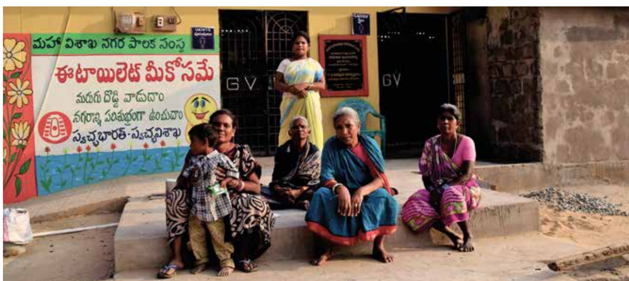
Baño público en Visakhapatnam, la India

El gobierno municipal utilizó las conclusiones de esta evaluación para diseñar y construir instalaciones de saneamiento para las mujeres en Warangal, incluyendo baños solo para mujeres.