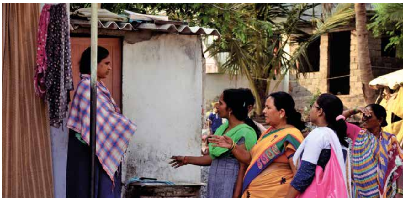
Participación comunitaria bajo la misión Swachh Bharat, Visakhapatnam, la India.

El ejercicio de mapeo reveló que más de 20,000 personas dependían de los bloques de baños públicos y comunitarios de la ciudad. De los 262 bloques en funcionamiento, el estudio encontró que solo seis se encontraban en 'buenas' condiciones. El mejoramiento de estas instalaciones se identificó como un componente esencial de las actividades a nivel urbano a fin de eliminar la práctica de la defecación al aire libre. En respuesta al ejercicio de mapeo y a la evaluación de las necesidades con respecto al género, se prestó especial atención a las necesidades de las mujeres y las niñas al mejorar 198 de estos bloques de baños, que comprendían aproximadamente 4,000 asientos de inodoro, en donde WSUP y la Greater Visakhapatnam Municipal Corporation implementaron planes de modernización con perspectiva de género.