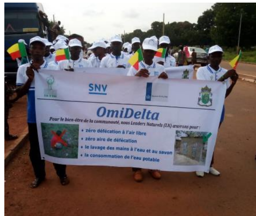
20240801-AEPHA-Benin-SIA N'SON Kandi_N022 Projet : « Accompagnement des communautés pour le maintien durable de l'état Fin de Défécation à l'Air Libre (FDAL) dans les Communes de Malanville, Karimama et Kandi » Activité : Participation des LN au défilé civil à l'occasion de la fête de l'indépendance nationale Emplacement où l'image a été prise : Voie inter-états Kandi-Ségbana