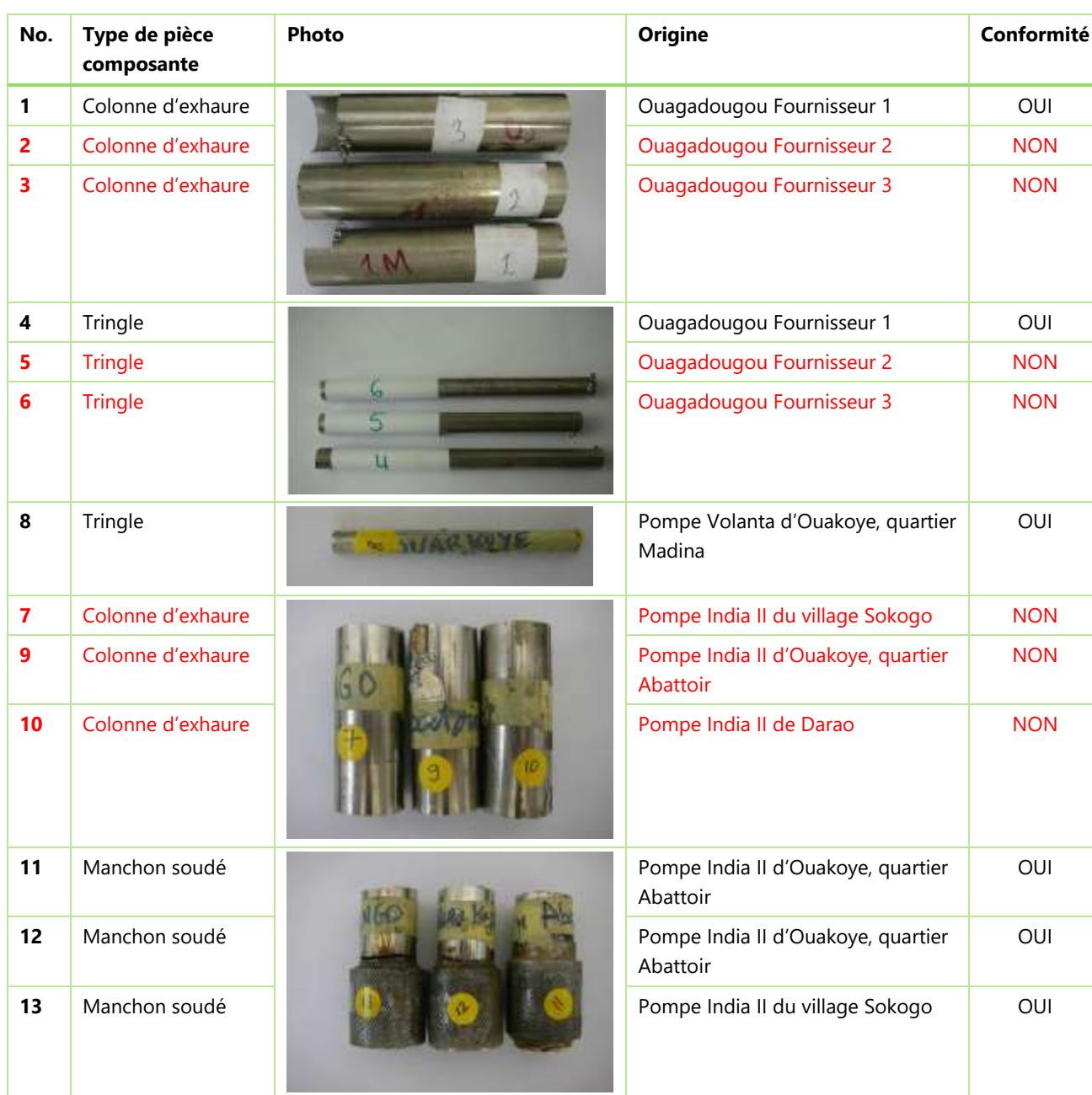
Tableau 1 Résumés des échantillons de pièces composantes testés et de leur conformité aux normes correspondantes

Parmi les six échantillons de colonnes d'exhaure, un seul était conforme à la norme internationale pour l'acier inoxydable SS304/304L. Deux tringles et les trois manchons à souder étaient conformes également. La faible teneur en nickel des cinq colonnes d'exhaure non-conformes signifie qu'elles sont moins résistantes qu'elles le devraient à la corrosion. De plus, les échantillons de pompes collectés directement sur les équipements installés dans les villages montrent que des matériaux de composition chimique différente sont parfois soudés entre eux, ce qui peut générer des processus électrochimiques qui sont facteurs de corrosion également. Des traces de plomb ont été identifiées dans deux des trois colonnes d'exhaure et dans deux des trois manchons à souder testés mais la faiblesse des concentrations relevées font qu'elles sont sans danger pour la santé humaine et pour l'environnement.