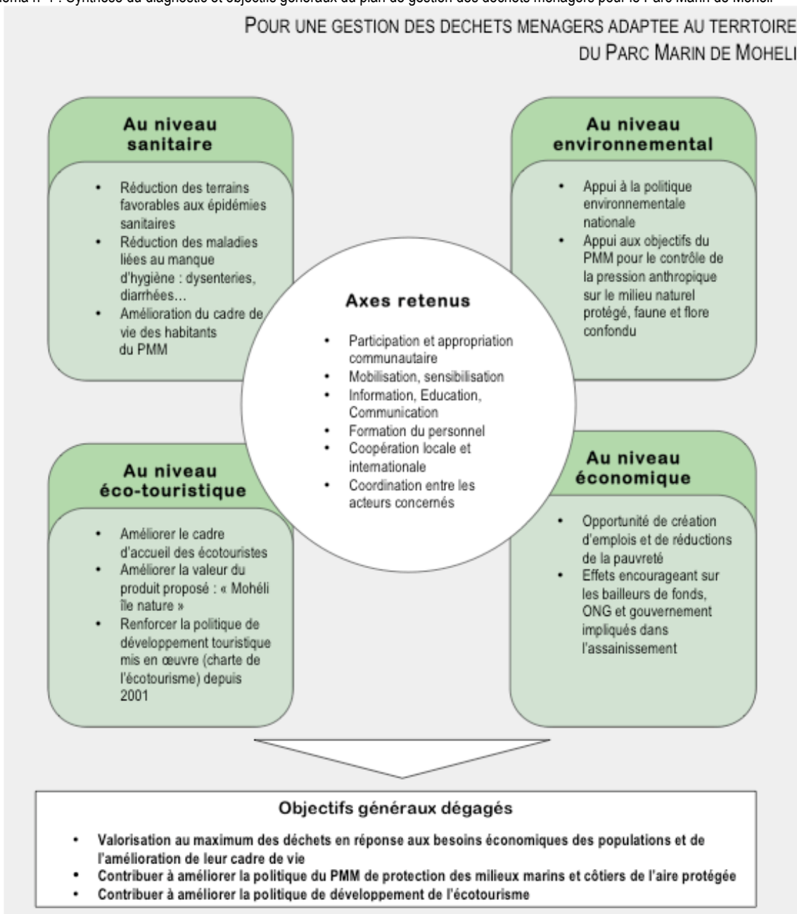
Schéma n°1 : Synthèse du diagnostic et objectifs généraux du plan de gestion des déchets ménagers pour le Parc Marin de Mohéli

Le schéma suivant récapitule la réflexion ayant mené à l'identification de ces objectifs généraux.