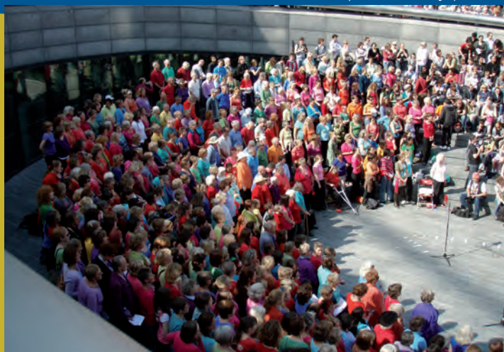
"Sing for Water", un acto para recaudar fondos.