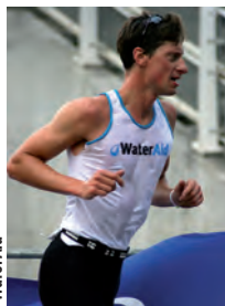
Participante en el triatlón de Londres, que recauda fondos para WaterAid

Además de contribuir a los acontecimientos de recaudación de fondos, los colaboradores de WaterAid participan también en las campañas de sensibilización e información. La comunicación y los datos sobre los resultados llegan a los donantes a través de la revista semestral (Oasis) y de un boletín electrónico bimensual. Las empresas del sector del agua informan sobre las acciones y las actividades de WaterAid a través de sus comunicaciones de empresa.