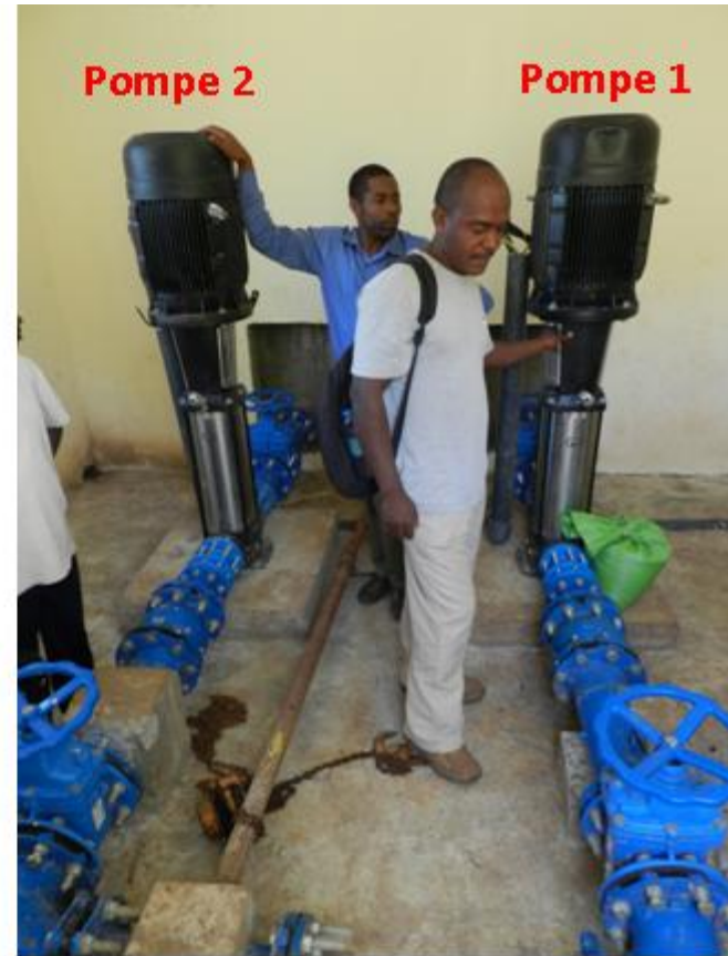
Station de Pompage de l'AEP/SIMA