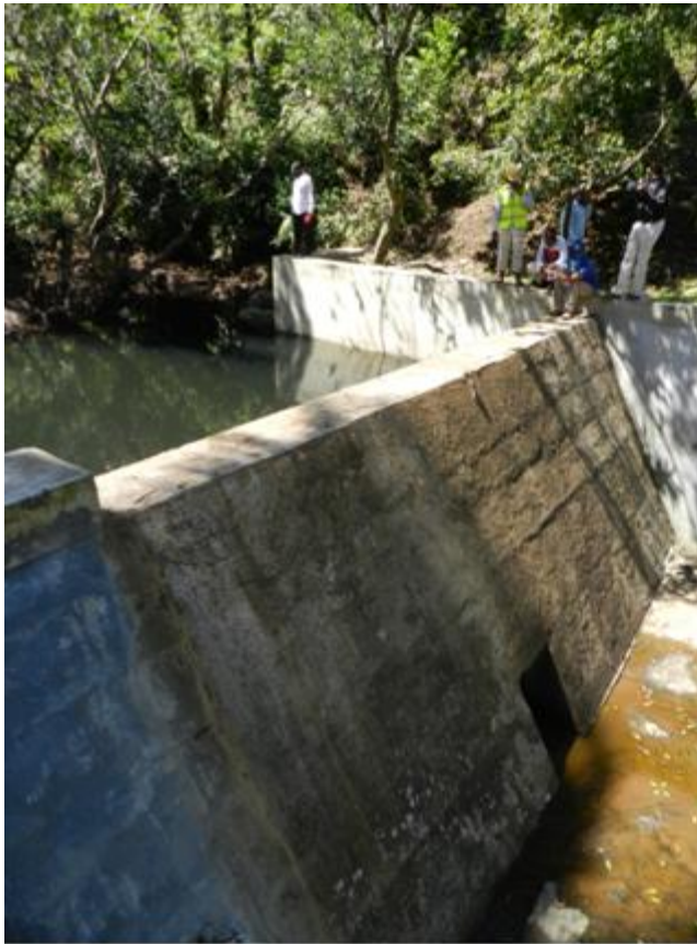
Barrage du captage de l'AEP/SIMA