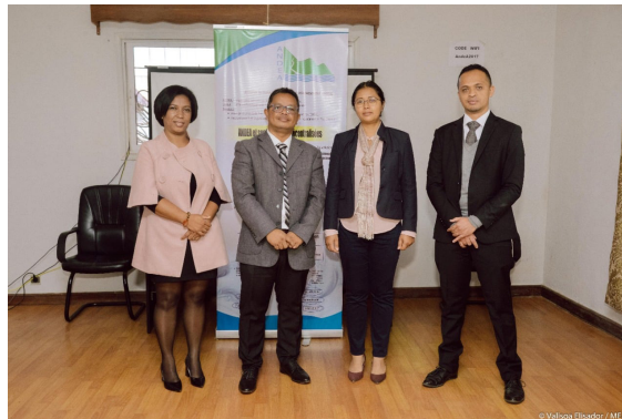
©Ministère de l'Eau, de l'Assainissement et de l'Hygiène Valisoa Elisador | 2021

L'Autorité Nationale de l'Eau et de l'Assainissement (ANDEA), organisme chargé d'assurer la gestion intégrée des ressources en eau à Madagascar (d'après le Code l'Eau et le décret n° 2003/192), dispose de nouveaux responsables suite au Conseil des Ministres du 19 Mai 2021.