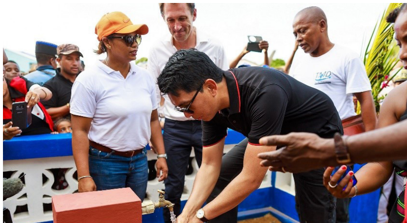
Inauguration des infrastructures par SEM Andry Rajoelina à Androka

Plus d'informations sur Transmad et le programme « Apporteurs d'eau » sur la page Facebook et le site internet de l'ONG .