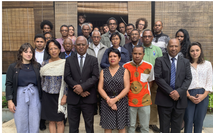
Les membres de l'assemblée générale de l'ONG Ran'Eau