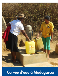
Corvée d'eau à Madagascar

Dans les pays du Sud, les femmes et les filles sont particulièrement concernées puisque habituellement responsables des corvées d'eau. Elles devront parcourir de plus longues distances et porter de plus lourdes charges en cas de manque d'eau.