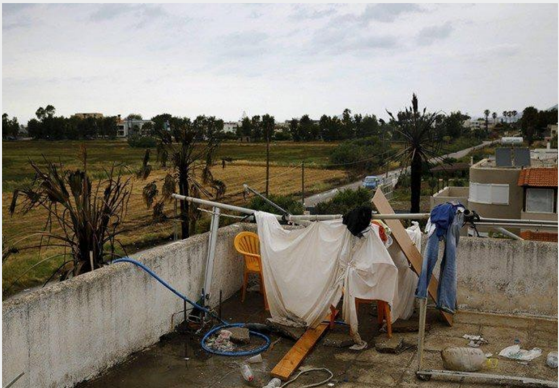
Une cabine de toilette de fortune, sur le toit d'un hôtel, où des centaines de migrants ont trouvé refuge, sur l'île grecque de Kos.