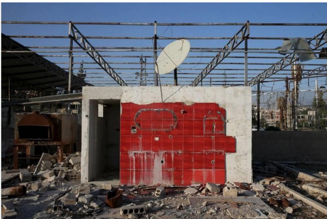
Des toilettes au milieu des débris, près de Damas en Syrie.