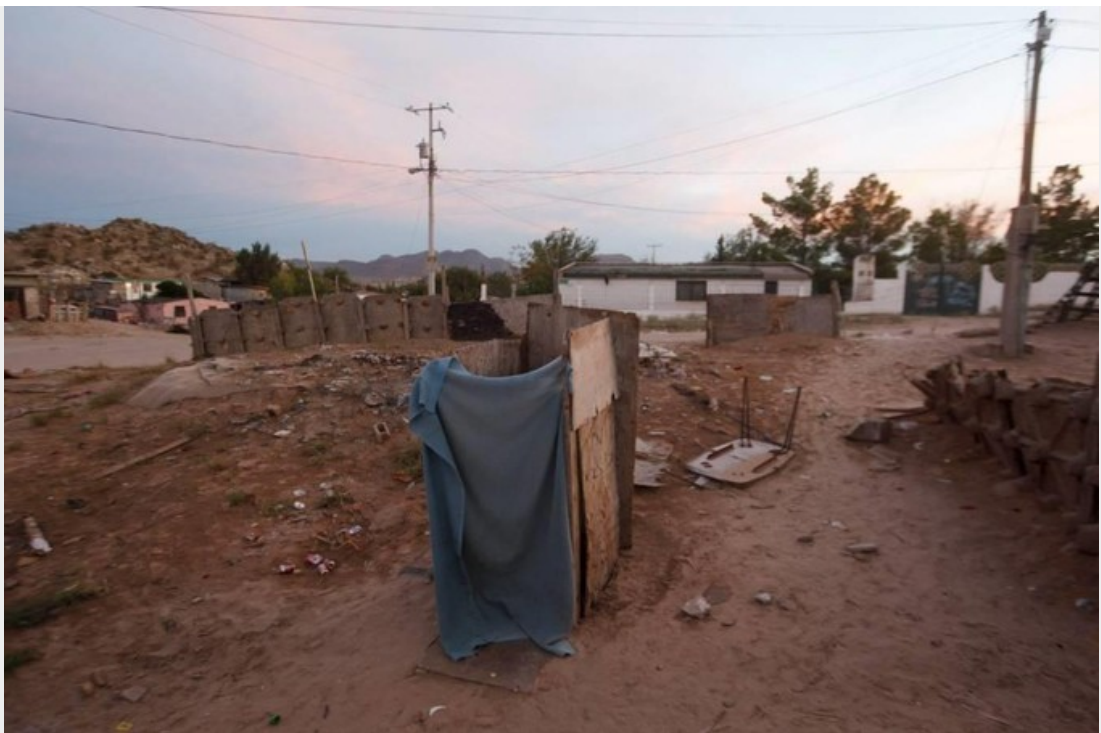
Dans un quartier pauvre de Juárez, au Mexique.