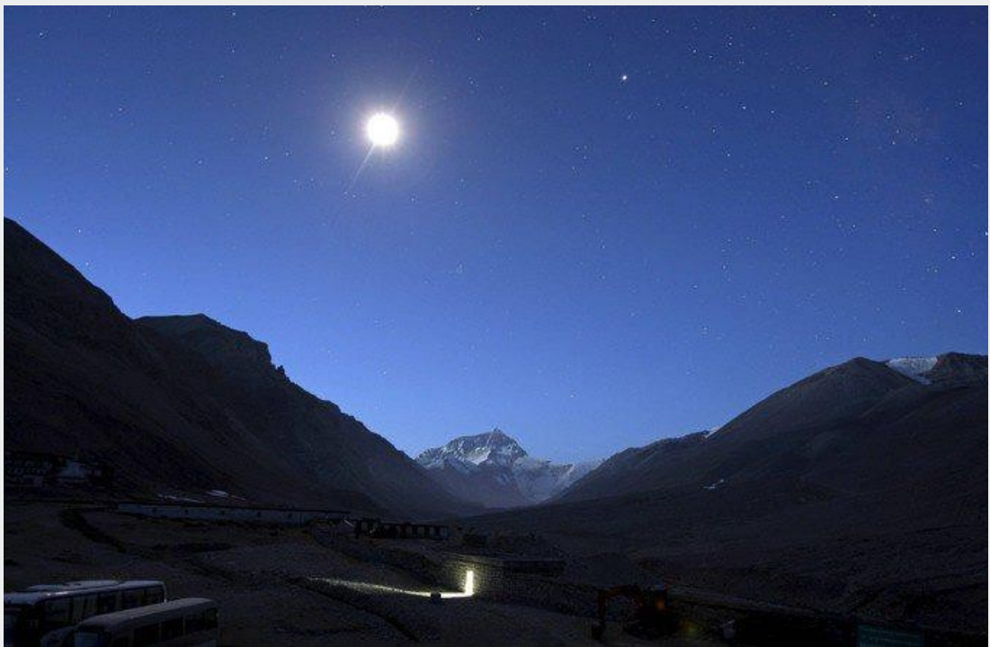
La porte illuminée est celle des toilettes, tandis que la Lune brille au-dessus du mont Everest, dans l'Himalaya.