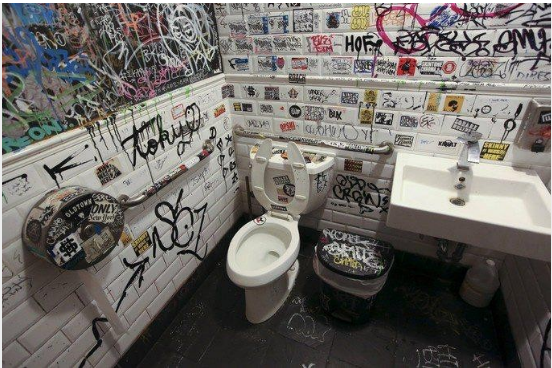
Les utilisateurs des toilettes d'un restaurant de Brooklyn, à New York, ont laissé libre cours à leur expression...