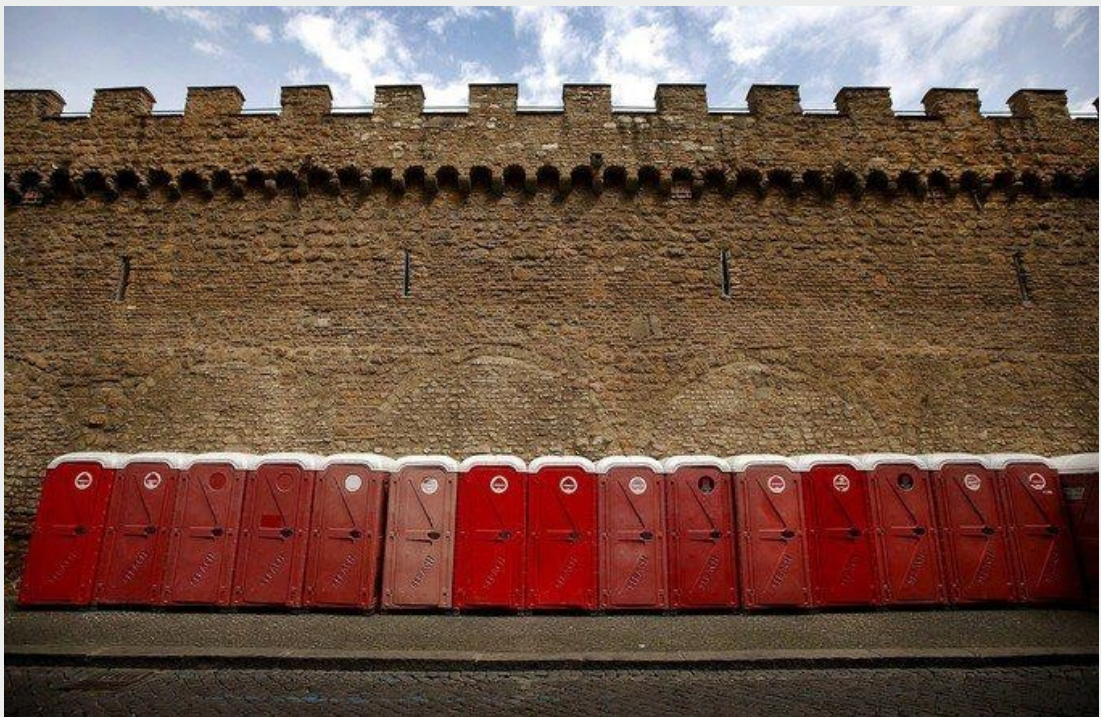
Des toilettes chimiques ont été installées dans le centre de Rome.