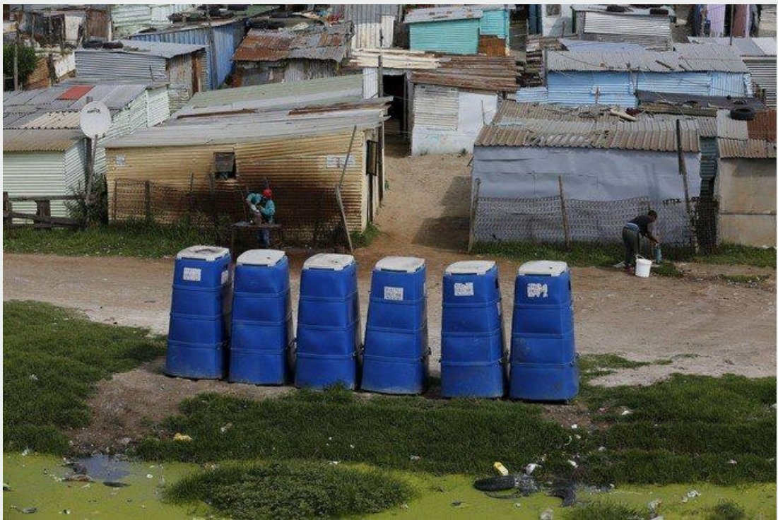
Des toilettes temporaires dans le bidonville de Khayelitsha, au Cap, en Afrique du Sud. Vingt ans après les premières élections démocratiques sud-africaines, la lente installation de services de base reste un point de tension dans plusieurs communautés.