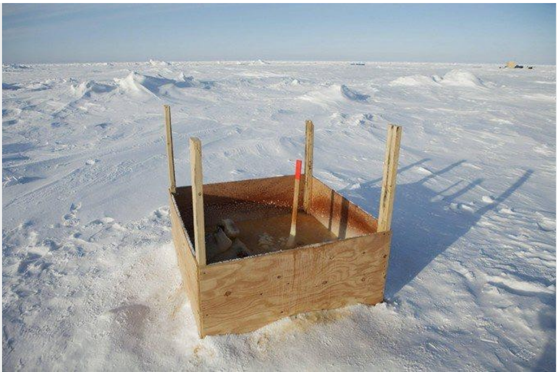
Ces toilettes ont été installées près de l'Applied Physics Laboratory Ice Station (Aplis), un laboratoire de recherche américain monté chaque hiver sur la banquise, en Alaska.