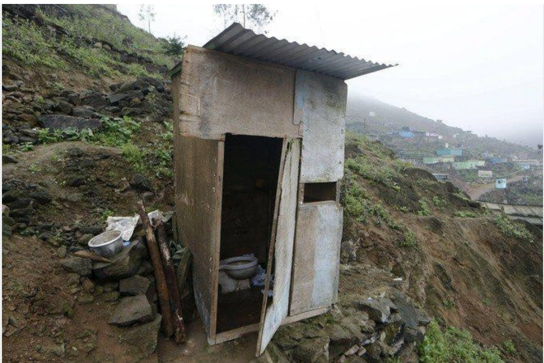
Dans le district de Villa María del Triunfo, à Lima, au Pérou, il n'y a pas d'eau courante et les familles achètent des citernes d'eau une fois par semaine.