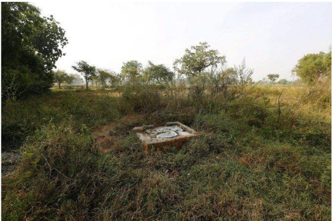
Des toilettes dans la nature en Inde.