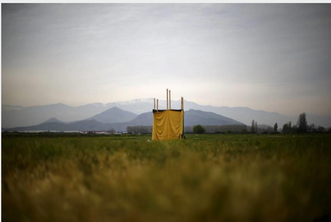
Au milieu d'un champ près de Santiago du Chili.