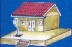
CITERNE D'EAU DE PLUIE

Les points d'eau à l'école peuvent être alimentés par différentes sources : citerne d'eau de pluie - borne fontaine - système de pompage