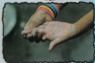
FROTTER Avec de l'eau et du savon