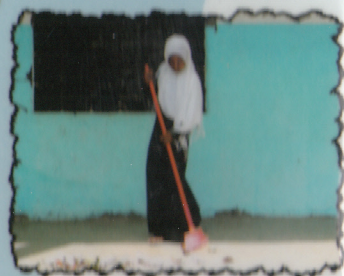
Nettoyer la cour