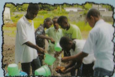
SE LAVER LES MAINS !!