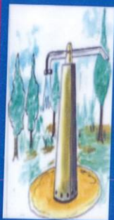
SYSTEME DE POMPAGE