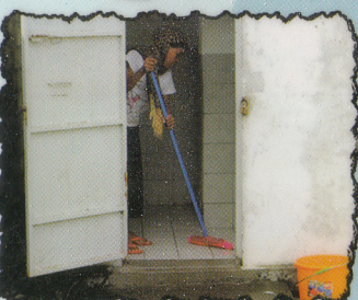
Nettoyer les latrines