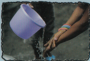
RINCER A l'eau propre