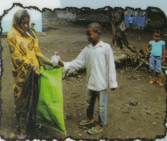
Jeter les ordures à la poubelle