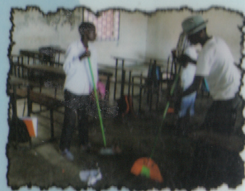
Nettoyer les classes