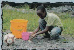
LES JEUX DEHORS