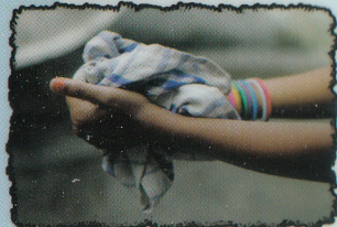
ESSUYER Avec une serviette propre