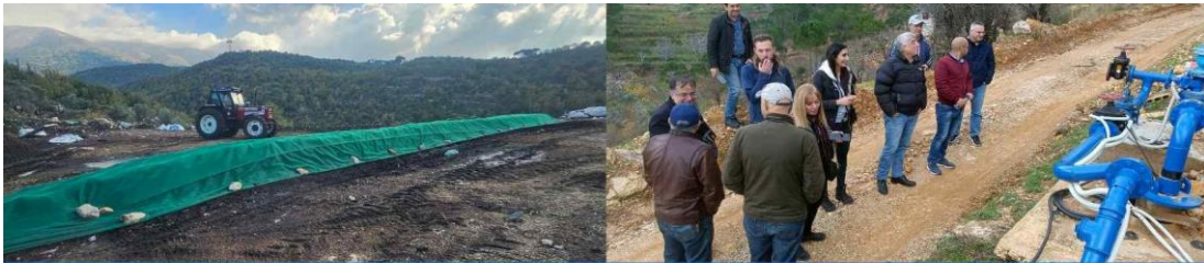
Exploring the Nexus in practice: meeting and field trip to the Shouf area in Lebanon

يقوم برنامج الشراكة العالمية للمياه - منطقة المتوسط (GWP-Med) بأنشطة في لبنان منذ عام 2022 ضمن برنامج البحر الأبيض المتوسط التابع لبرنامج الأمم المتحدة للبيئة، وفي إطار مرفق البيئة العالمية (GEF UNEP MedProgramme). تهدف تلك الأنشطة إلى تقييم الفرص التي يوفرها نهج الترابط بين المياه والطاقة والغذاء والنظم البيئية (WEFE) في تعزيز أمن الموارد الطبيعية في لبنان. وتماشياً مع إطار المشروع المتمحور حول "معالجة قضايا الترابط التي تؤثر على المناطق الساحلية ذات الأولوية في النظم الإيكولوجية البحرية الكبيرة في البحر الأبيض المتوسط"، أجريت زيارة ميدانية إلى الشوف وعُقد اجتماع في المنطقة. وشارك تسعة ممثلين/ات عن المؤسسات والإدارات اللبنانية المتعلقة بإدارة موارد المياه، والطاقة، والزراعة/الأمن الغذائي، والحماية البيئية، في اجتماع وزيارة ميدانية إلى مشاريع الترابط في منطقة الشوف، بهدف معالجة عمليات التبادل بين مختلف القطاعات وتوليد المزايا الاجتماعية والاقتصادية والبيئية. وقد نظم برنامج الشراكة العالمية للمياه - منطقة المتوسط هذه الزيارة الميدانية في إطار جهوده لتعزيز الحوار البناء، والتعلم المتبادل، والتعاون مع المشاريع المماثلة المنقّدة في البلاد، بهدف تشجيع تكرار الممارسات الفضلى التي تساهم في تعزيز أمن الموارد الطبيعية في لبنان.