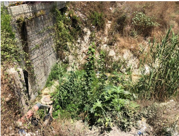
الصورة رقم 2: أنابيب الصرف الصحي المنزلي

تتفّذ المبادرة حالياً مشروعاً في نهر الكاملة، الذي يمتدّ على مسافة 3 – 4 كيلومترات ويتغذى من 10 مصادر. وقد اختارت للمدينة إطلاق العمليات التجريبية من مصدر النهر المعروف باسم نهر السقاية، بهدف تسليط الضوء على التحديات التي تطل النهر وتهدده، وذلك تمهيداً لإطلاق عملية إعادة تأهيله وتحويله إلى موقع استجمامي وترفيهي.