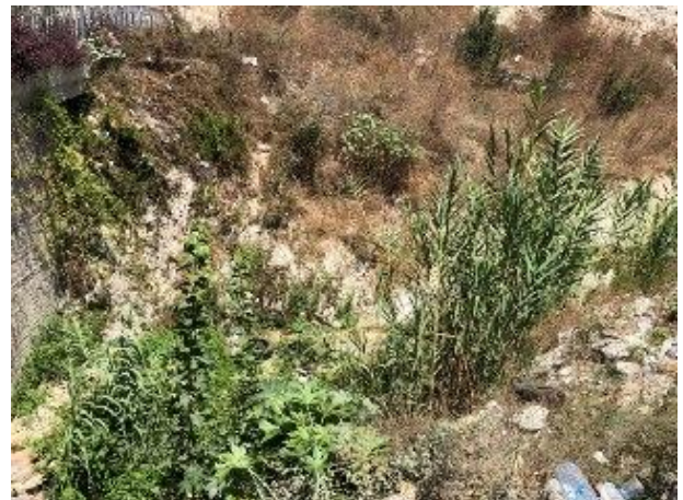
الصورة رقم 1: مطامر النفايات الصلبة