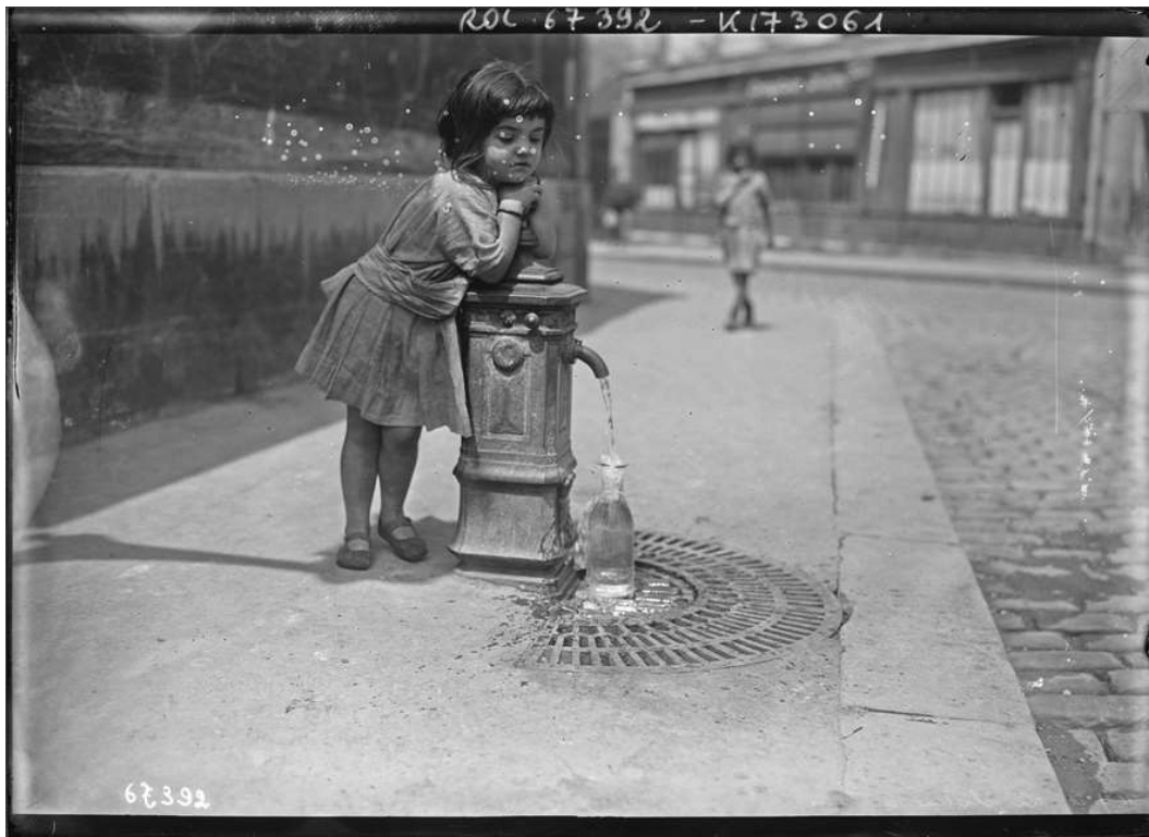
L'été 1921 à Paris

L A simplification du « mille-feuilles territorial » engagée par les lois de décentralisation élaborées puis mises en oeuvre à partir de 2012 — la loi MAPTAM en janvier 2014 (1), puis la création de Grandes régions en janvier 2015 (2), avant la loi NOTRe d'août 2015 (3) — va mettre un terme à plus de deux siècles de compétences communales, avec pour objectif affiché de rationaliser la gestion de l'eau.