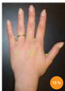
Après avoir utilisé juste de l'eau et du savon