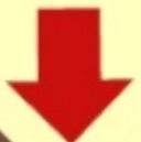
4. Kosehina tsara ny hoho