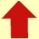
7. Kobanina tsara