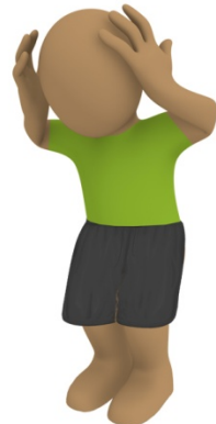
Dores de cabeça