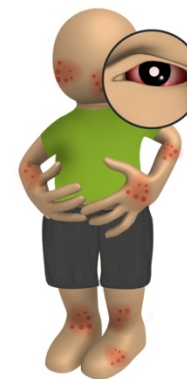
Erupção na pele, Olhos vermelhos