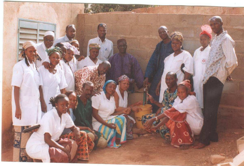
La joie de toute l'équipe du CSCOM à l'arrivée de l'eau, devant le mur de clôture terminé

HORIZON 54 continuera le soutien du centre. Il reste à réaliser une partie de la plomberie et la réfection des peintures pour un accueil des patients plus agréable. La propreté du centre et des abords est maintenant une priorité. Nous avons rencontré le Maire de la commune et avons convenu de mettre en place des réunions de concertation avec les habitants du quartier et les responsables du CSCOM.