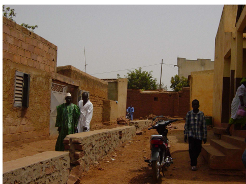
Le mur, au début

Nous avons programmé les actions sur 8 mois, entre Février et Septembre 2009. Les bénévoles d'HORIZON 54 se sont rendus au Mali en Février et Octobre 2009 et ont constaté qu'il faudrait quelques mois supplémentaires pour terminer le chantier. Lors de leur dernière mission, en Février 2010, ils ont pu faire le bilan de l'action avec les responsables du CSCOM, les représentants d'HORIZON 54 à Bamako et rencontrer le Maire de la Commune.