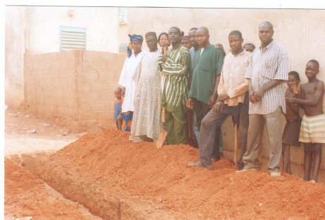
à l'arrière, le mur presque terminé