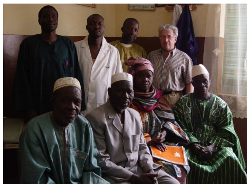
Réunion avec les membres de l'ASACO