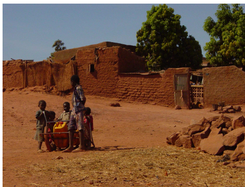
Corvée d'eau à Sabalibougou

La création des CSCOM (centres de santé communautaires) dans le quartier de Sabalibougou a été très appréciée des habitants qui étaient obligés de se rendre dans les grands hôpitaux de Bamako pour y faire leurs consultations, ce qui posait d'énormes problèmes d'accessibilité compte-tenu de leurs revenus très faibles. Ce sont des associations d'habitants (associations de santé communautaires) qui assurent la gestion des CSCOM. Le quartier de Sabalibougou regroupe 25 % de la Commune V du District de Bamako, soit 62 728 habitants. Il y a trois CSCOM sur le quartier parrainés par l'association HORIZON 54.