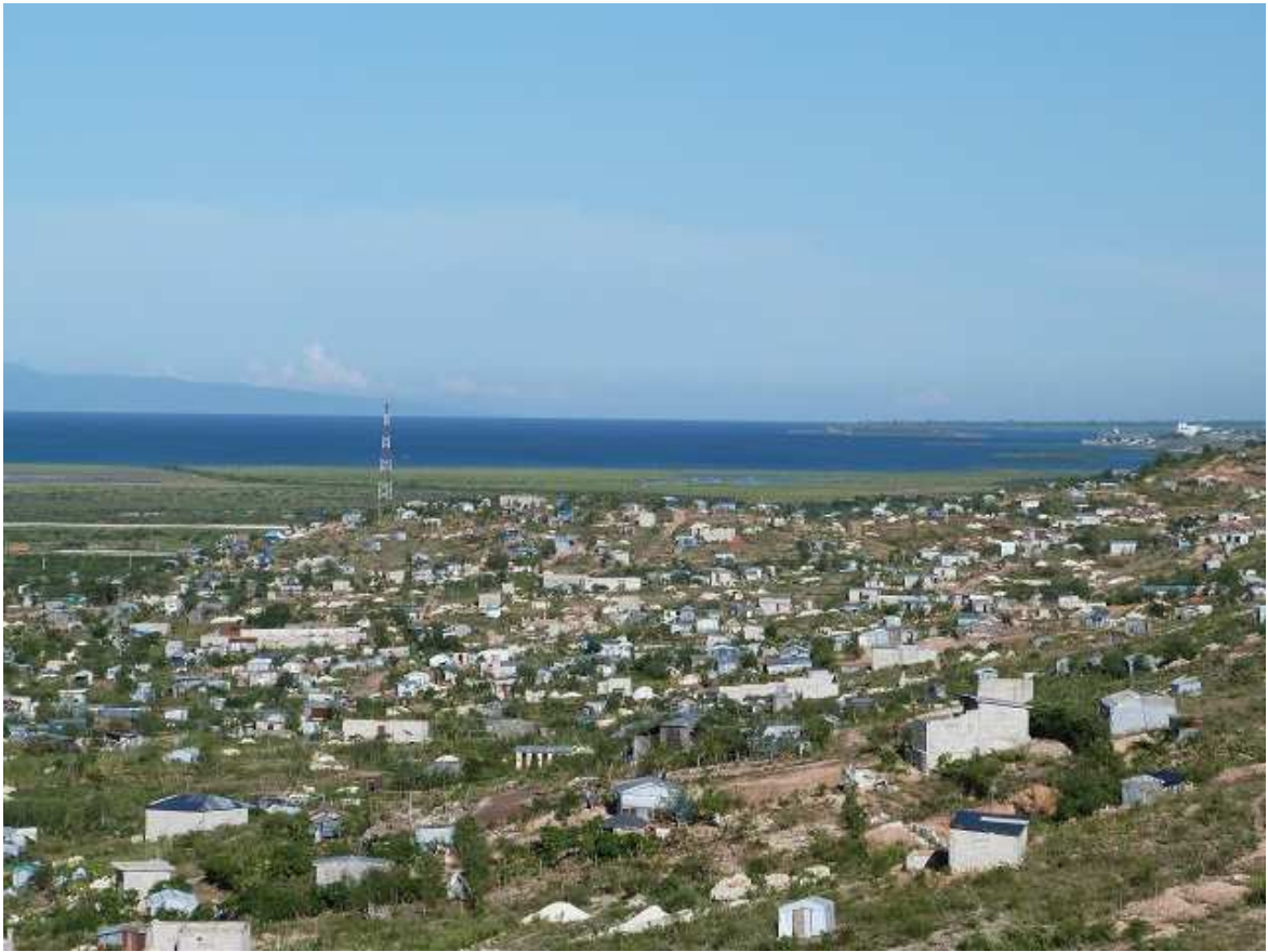
Site de Canaan (Aire Métropolitaine de Port-au-Prince, Septembre 2012)