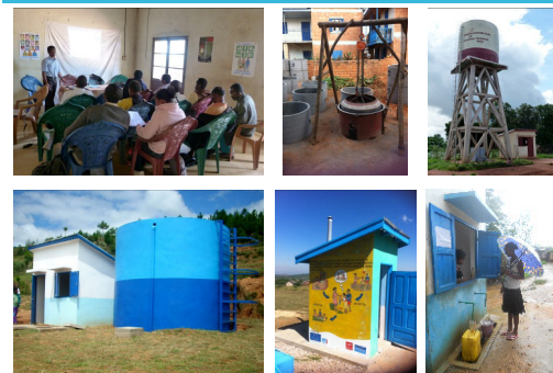
De gauche à droite: une réunion communale, un atelier d'un Diotontolo, un réservoir sur tour, un réservoir au sol, un bloc sanitaire avec un message d'hygiène et un kiosque à eau.