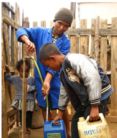
Un branchement partagé pour plusieurs ménages - Ambohibary

ment, est en charge de mettre en œuvre le projet. Il sera épaulé par la direction générale de l'Eau et de l'Assainissement et ses directions régionales dans la définition de la stratégie d'intervention. L' Autorité nationale de développement de l'Eau et l'Assainissement veillera à la gestion intégrée des ressources en eau. Les communes seront au centre des activités en assurant le rôle de maître d'ouvrage. Enfin, les opérateurs privés qui assurent la production, la vente des toilettes, la gestion des réseaux d'eau, les services de vidange ou les blocs sanitaires, devront rendre pérennes les services en les garantissant de manière professionnelle.