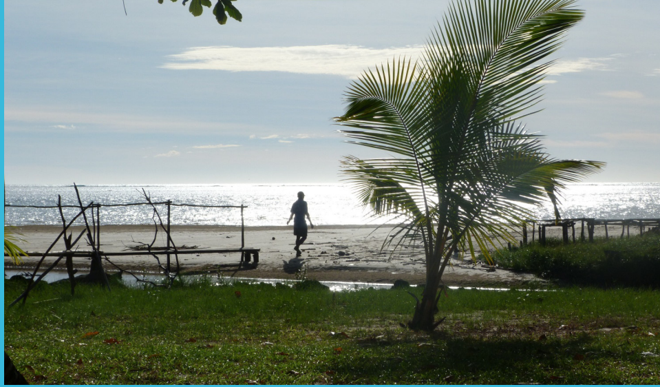
Le site de Mahambo