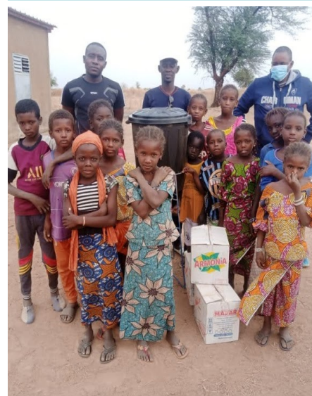
Lutte contre le COVID-19: Distribution de kits d'hygiène dans les établissements scolaires, les centres de santé et les mairies

Un ensemble de rencontres prévues en France au dernier trimestre 2020 ont malheureusement dû être annulées également, néanmoins la mobilisation des partenaires reste entière, à l'issue de la première année de projet.