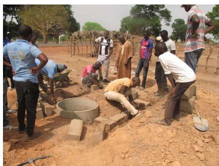
Formation des maçons à la construction d'édicules publics pour les écoles, centres de santé et autres lieux publics