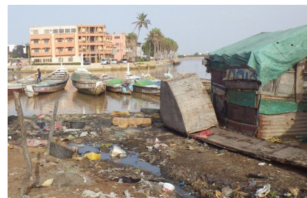
La quartier de Guet Ndar mêle actuellement l'insalubrité avec une très forte densité de population