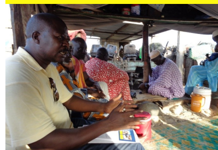
Réunion de sensibilisation auprès des sages du quartier, les « Barack Bi »

Cette étude sera réalisée en partenariat avec des spécialistes de la santé publique de l'Université Gaston Berger de Saint-Louis.