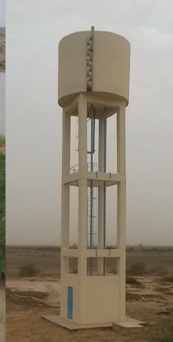
Unité de potabilisation et château d'eau de Diagambal (Aicha 1)