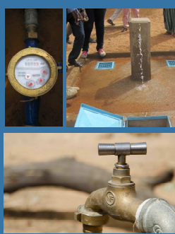
Bornes fontaines, abreuvoirs et 1 000 branchements particuliers