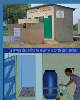
Blocs sanitaires et sensibilisation scolaire