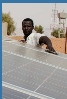
Étude de référence sur le pompage solaire