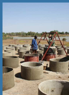
Appui d'opérateurs locaux à la production et vente de toilettes