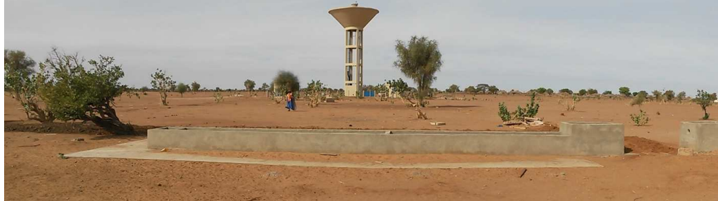
Abreuvoir et château d'eau à Wendou Diamy (Aicha 1)