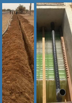
Extensions de réseau et renforcement d'une station de potabilisation