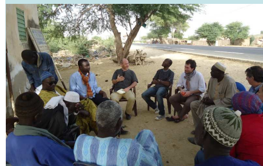
Réunion avec l'ASUREP de Diagambal