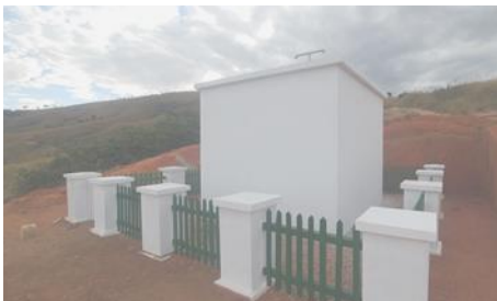
Réservoir à Anjomà Itsara.

est prévue pour fin juillet aussi. Certains de ces chantiers seront inaugurés prochainement.