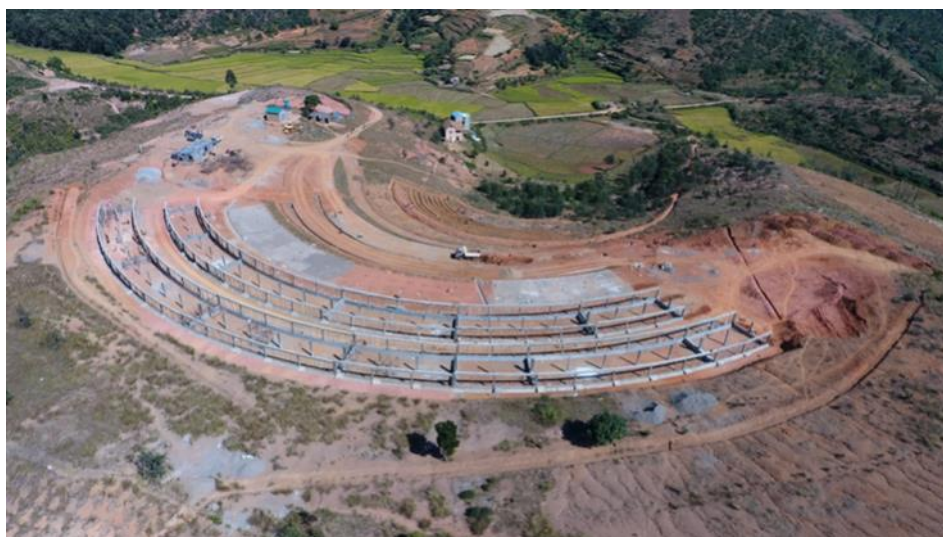
Vue aérienne du station de de traitement des boues de vidanges à Ambaisamotra.

Sur le résultat 2: gestion des boues de vidange, la construction de la station de traitement des boues de vidange de la ville est à 75 % d'avancement au 22 mai. Bien que, la fin contractuelle soit prévue pour juin 2021, en raison des diverses contraintes techniques et sanitaires, la fin est estimée à mi-juillet 2021. Le 29