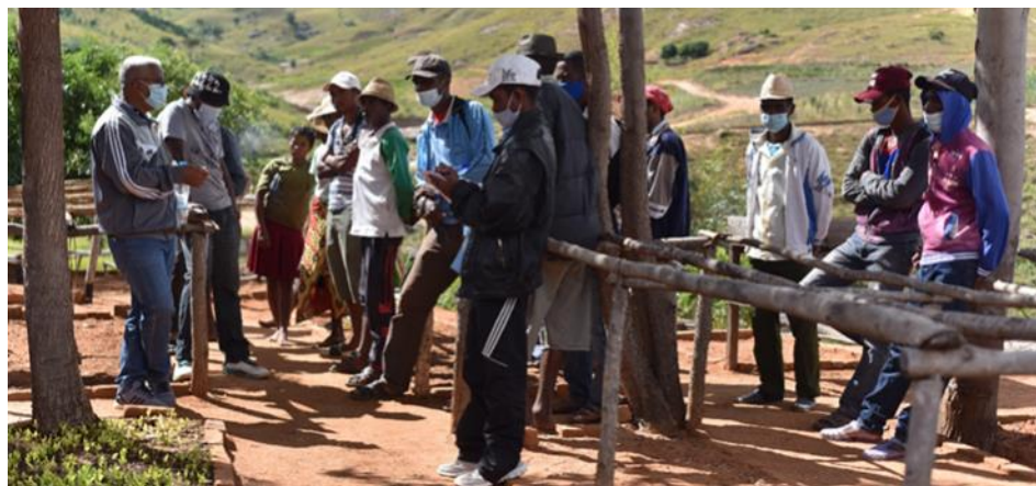
Présentation du BV Soarano par le Maire de la Commune Ambalavao

(Voir les publications du GSDM : https://gsdm-mg.org/documentations/publications/ )