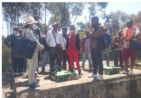
Echanges des participants avec le délégataire de Sahambavy au niveau du réservoir

Deux journées en salle et une journée à Sahambavy ont permis aux participants de mieux s'approprier la thématique leur permettant prochainement d'échanger sur leur option au sein de leur conseil communal respectif avant le lancement effectif des DSP.