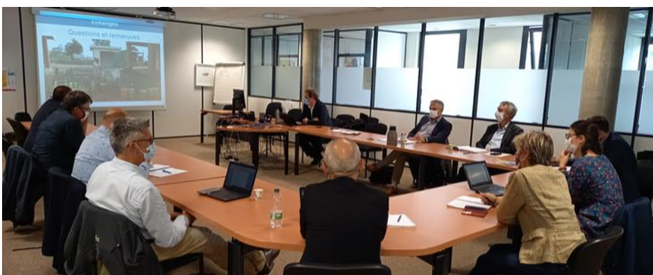
Elue, directeurs, agents des services de la Métropole de Lyon, de l'Agence de l'Eau Rhône Méditerranée Corse et de la SAUR lors de la restitution de l'évaluation présentée par le directeur d'Hydroconseil à Lyon

Les résultats de l'évaluation sont positifs et les analyses proposées devraient alimenter la réflexion des élus de la Métropole de Lyon et de la Région Haute Matsiatra sur l'avenir de la coopération décentralisée.