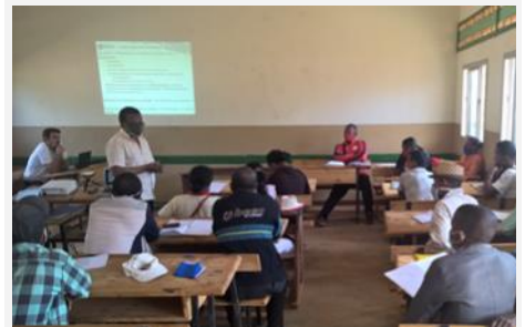
Echanges sur Anjoma Itsara

Au début de la collaboration avec le programme Eaurizon, les communes sont invitées à produire un document de planification appelé Plan Communal de Développement en Eau et Assainissement (PCDEA). La production et validation aura presque pris un an pour les communes d'Ankaramena, Anjoma Itsara, Ambalakely (nouveaux PCDEA) et Nasandratrony (mise à jour) mais ces 4 communes disposent dorénavant d'un document de planification sur le secteur qui liste les activités à mener et les priorités d'investissement sur les années à venir.