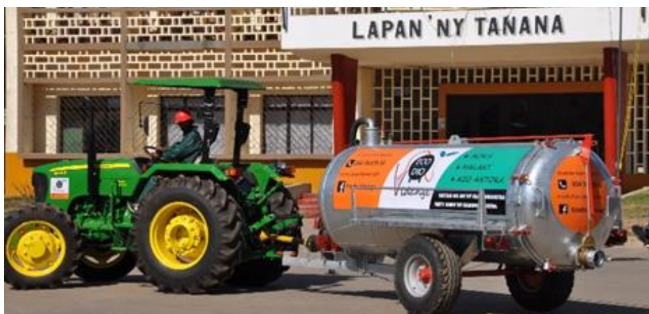
Le tracteur et la tonne à lisier du service de vidange

blique. L'accompagnement à son application a débuté par la mise en place des panneaux d'orientation vers les blocs sanitaires de la ville. Une équipe d'animateurs sociaux a été opérationnalisée et ils informeront les citoyens Fianarois sur la nouvelle réglementation municipale de l'assainissement et de l'hygiène, et du service de gestion des boues de vidange ECO DIO.