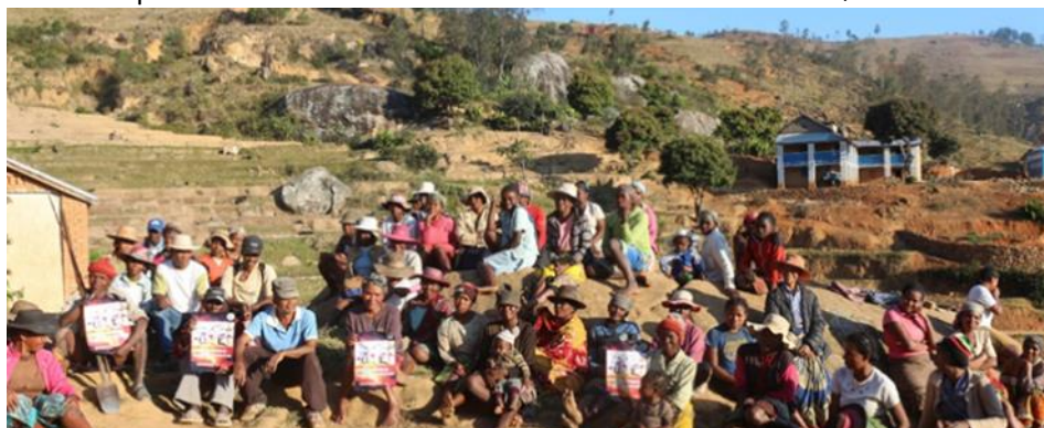
Séance de sensibilisation au niveau local – BV Sahavania / Commune Anjoma

En tant que maître d'ouvrage, l'implication des Communes est essentielle pour que la population soit mobilisée tant sur le plan préventif, curatif que répressif.