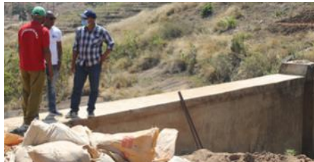
Réunion de chantier avec le maire sur le barrage en cours de curage à Ambalavao

A noter que les études pour la prochaine phase de travaux 2021 /2022 démarreront dès le mois de novembre.