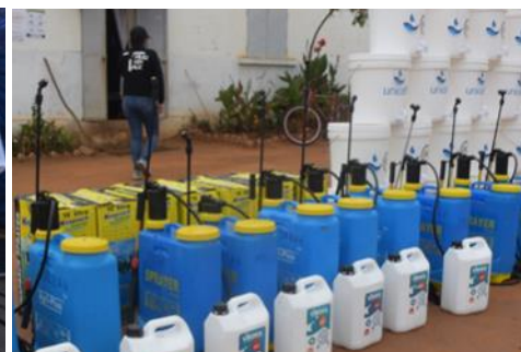
A gauche: barrage sanitaire avec prise de température. A droite: matériels de désinfection