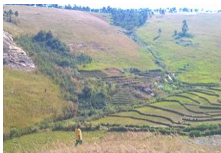
Bassin versant d'une source qui sera exploitée à Anjoma Itsara

Des discussions sont également en cours pour débloquent des fonds spéciaux dans le cadre de la riposte Covid. Ces fonds seraient alors destinés à la réalisation de blocs sanitaires localisés au niveau des lieux de passages importants (marchés, gares).