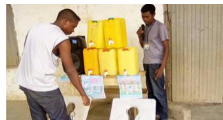
Animation sanimarché à Mahasoabe

sur les communes de Ialananindro, Ivoamba, Nasandratrony et Vohiposa.