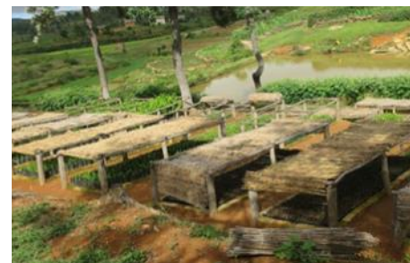
Vue de la pépinière de Mahaditra

son pluvieuse (novembre). La réussite de la campagne dépendra, surtout de la motivation des pépiniéristes et de l'implication des communes.