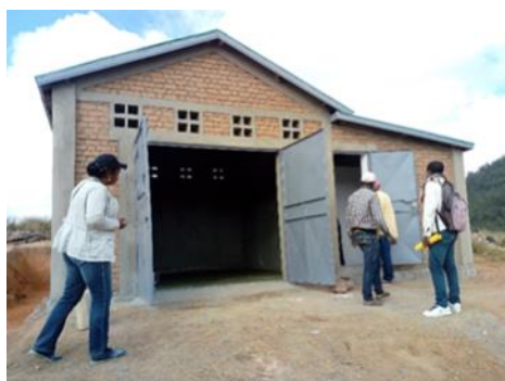
A gauche : bâtiment de stockage de la station. A droite : aménagement de la piste d'accès

Concernant le Résultat 2 , lié au service de Gestion des Boues de Vidange, les travaux sur le bâtiment de gardiennage et de stockage ainsi que la sécurisation de l'entrée de la station sont achevés.