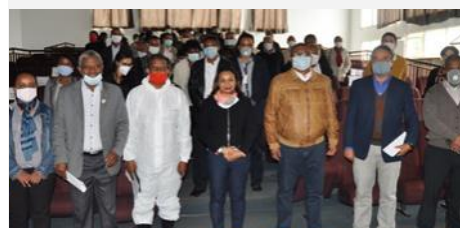
Mme la Ministre EAH, avec M. le Gouverneur de la Haute Matsiatra à sa gauche et les acteurs WASH