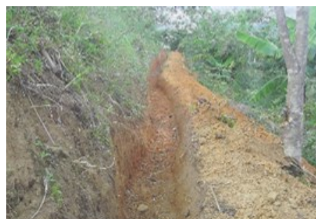
Fossé de protection en amont d'un captage

Sur la préservation des ressources en eau, le volet 4 du programme, ce sont 9 bassins versants qui ont été aménagés. Les aménagements se sont concentrés sur l'amont des captages par la création de fossés de protection, de pare-feu et de reboisements ciblés.