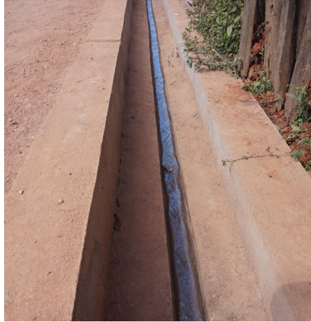
Canal d'assainissement d'eaux grises (débits temps sec) et pluviales réalisé sur Ambalavao

Cette vague de projet permet à 6 800 personnes et 4 500 écoliers d'avoir accès à l'eau. Le réseau d'assainissement d'Ambalavao bénéficie aux 30 000 habitants résidants sur la zone urbaine.