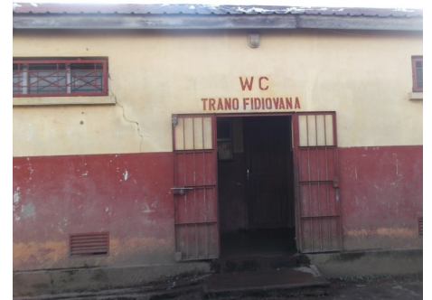
Bloc sanitaire à Anjoma à réhabiliter

La commune et les techniciens travaillent aussi à identifier les investissements prioritaires à réaliser sur les blocs sanitaires de la ville, qu'il s'agisse de réhabilitation ou de nouvelles constructions. A noter également, les démarches engagées pour identifier un terrain susceptible d'accueillir le futur site de traitement des boues de vidanges. Sur cette thématique les délais peuvent être importants et il est apparu essentiel aux acteurs de démarrer rapidement cette activité.