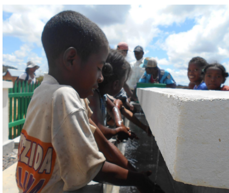
Ecoliers de lalanandiro se lavant les mains

Le second volet lié à l'accès à l'eau potable a été riche en activités avec dans un premier temps pas moins de 7 études avant-projets qui ont été réalisées aussi bien sur les aspects techniques, que socio-économiques ou financiers. Ces études concernaient les réseaux qui seront réalisés sur cette année 2017 et qui devraient bénéficier à plus de 12 500 personnes et 6 700 écoliers. Sur les réseaux déjà réalisés, tous les gestionnaires ont été formés pour assurer une gestion pérenne de ces ouvrages.