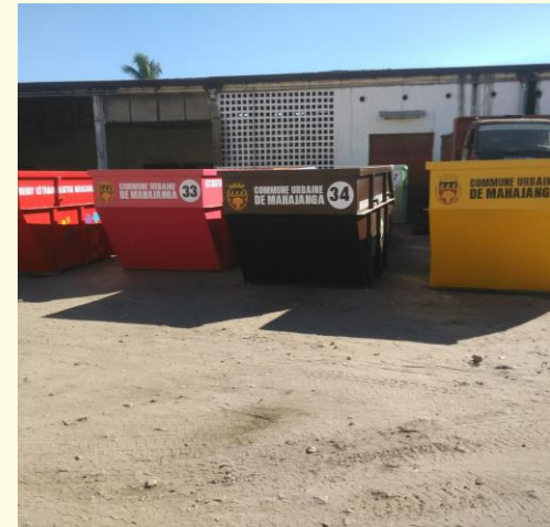
Au droite: les bennes à