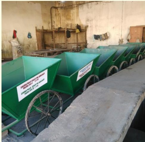
A Gauche : série de charriots, ordures