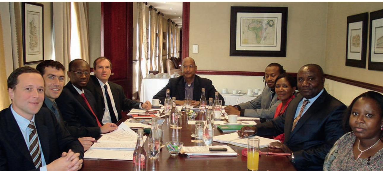
GAAC meeting, March 2011, South Africa