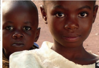
1, 2, 3, 4/ People living around Tanganyika Lake, Kalemie, Democratic Republic of Congo — Population vivant autour du Lac Tanganyika, Kalemie, République Démocratique du Congo