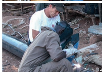
1, 2/ Water network installation, Kalemie — Pose du réseau d'eau, Kalemie 3/ Repair work, Uvira — Travail de réparation, Uvira 4/ Welding training, Kalemie — Formation à la soudure, Kalemie

and other organisations) are participating with local municipalities, the Ministry of Public Health and Regideso in: