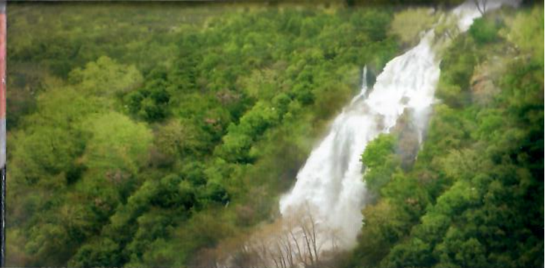
شلال كفرخلده، البترون.