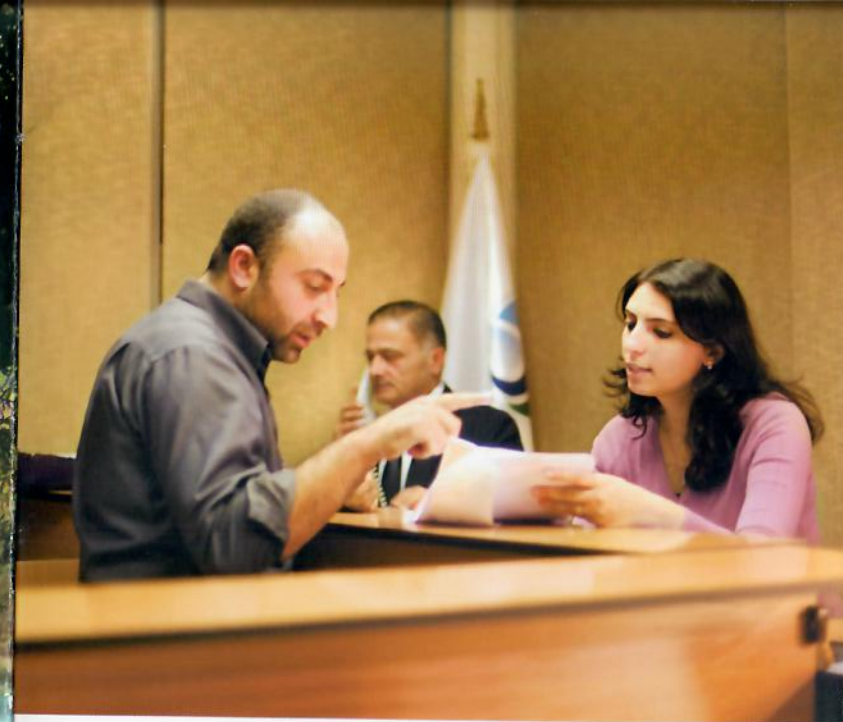
مركز خدمة الزبائن في طرابلس.