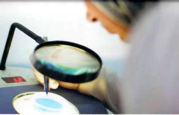
مختبر المنار، المختبر المركزي في طرابلس.