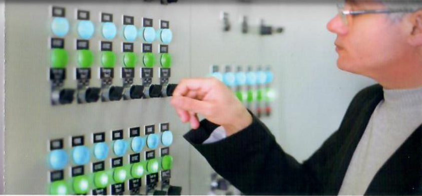
محطة هاب للتنقية.