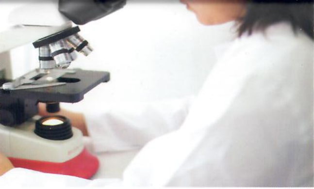
المختبر المركزي في زحلة