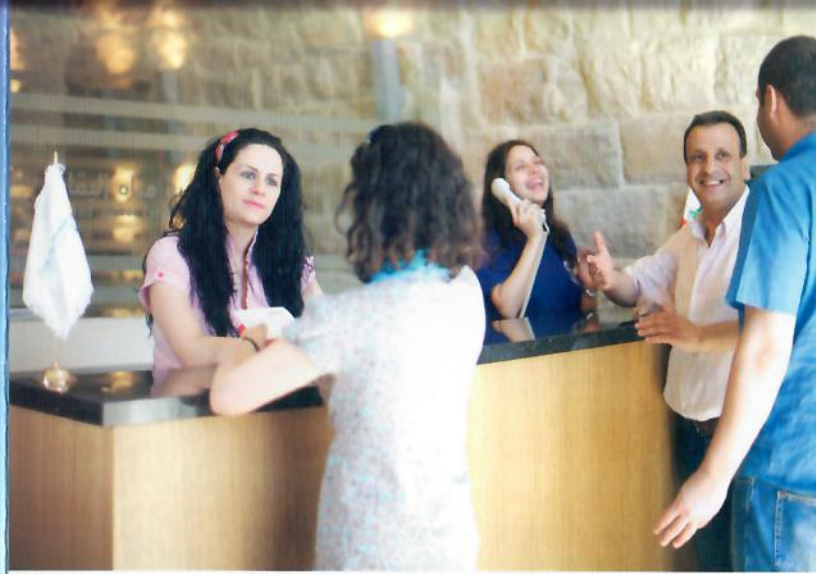
مركز خدمة المشتركين في دائرة زحلة

نسعى لنيل ثقتكم ورضاكم بتوفير مياه سليمة ومستديمة لنصبح خياركم الأول.