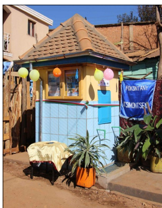
La Borne fontaine, décorée pour l'occasion