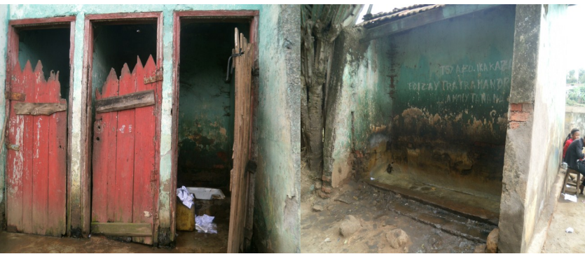
WC public d'Ampatana à démolir et à remplacer par une nouvelle construction d'un bloc sanitaire

En ce qui concerne le bloc sanitaire et le lavoir publics, des enquêtes préalables ont été réalisées par les équipes de EAST afin d'évaluer l'état des infrastructures existantes et d'identifier les modes de gestions qui y sont appliquées. Après les analyses des données collectées, les concertations avec la Commune, les Fokontany et les usagers de ces ouvrages communautaires, il a été décidé que EAST allait réhabiliter le bassin lavoir d'Atsimotsena et construire un nouveau bloc sanitaire à Ampatana. Les travaux devraient être entamés début Octobre.