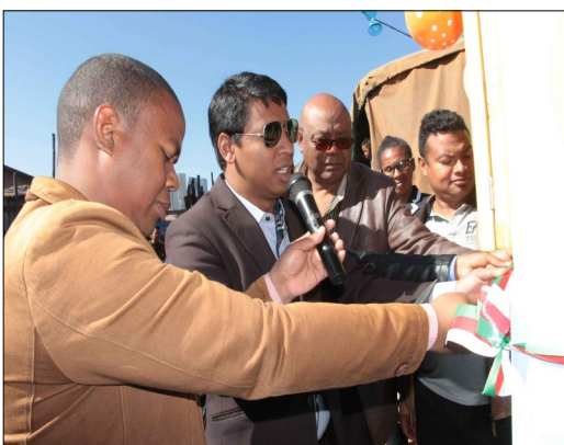
Inauguration de la borne fontaine d'Atsimotsena

Le 28 Juillet 2017, les huit bornes fontaines ont officiellement été inaugurées ce jour-là. La cérémonie a été honorée par la présence des autorités locales et les partenaires de l'ONG EAST: la Commune Urbaine et les sept Fokontany, la Préfecture d'Antsirabe, la Région de Vakinankaratra , les Arrondissements administratifs, la Direction Régionale de l'Eau Assainissement Hygiène et celle de la Santé Publique, ainsi celle de la JIRAMA y ont été présents. Les membres des six Associations des Usagers de l'Eau ont été également conviés. L'ouvrage choisi pour l'inauguration a été la borne fontaine d'Atsimotsena. La cérémonie, qui s'est tenue à la CRNIFP d'Ivory, a été l'occasion d'entendre plusieurs discours, dont celui du responsable de EAST, expliquant l'importance capitale de la prise de responsabilité et de l'appropriation du projet par les diverses parties prenantes au projet. Ce même jour, toutes les bornes fontaines des cinq autres quartiers ont versé leurs premières gouttes d'eaux dans les seaux des habitants, qui y sont venus très nombreux. Bref, le moment tant attendu est enfin arrivé !