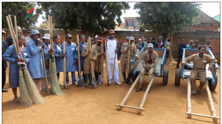
Les agents FAMAFA Ivory