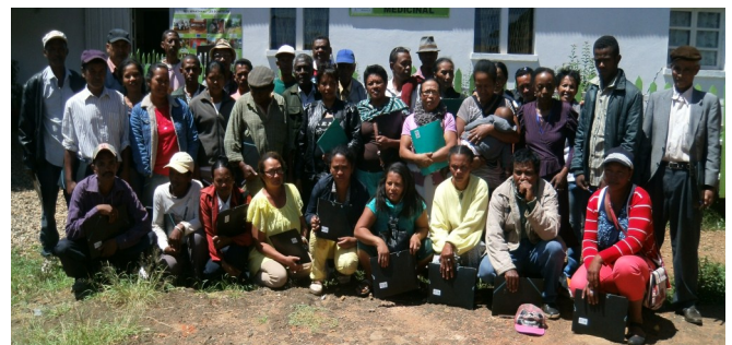
Photo d'ensemble des membres des six AUE