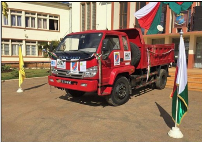
Camion benne rouge devant l'Hotel de Ville Antsirabe

Le Représentant de EAST a ainsi donné les clés du véhicule au Maire de la ville qui s'est réjoui de le faire démarrer devant l'Hôtel de ville ! Pour l'occasion, le Ministre de l'Enseignement Supérieur et de la Recherche Scientifique, le Ministre de l'Eau, de l'énergie et des hydrocarbures, le Ministre de l'Agriculture et de l'Elevage, le Ministre de l'Aménagement du territoire ainsi que le Chef de Région de Vakinankaratra ont également assistés à cette cérémonie.