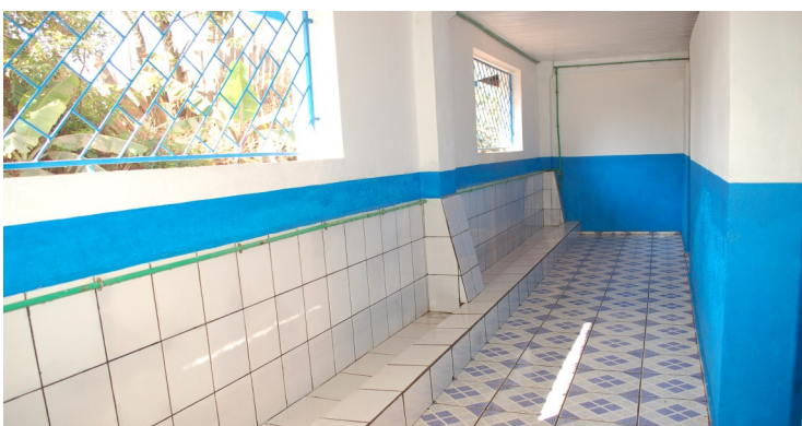
Bloc sanitaire de 'EPP Ivory réhabilité (APRÈS)