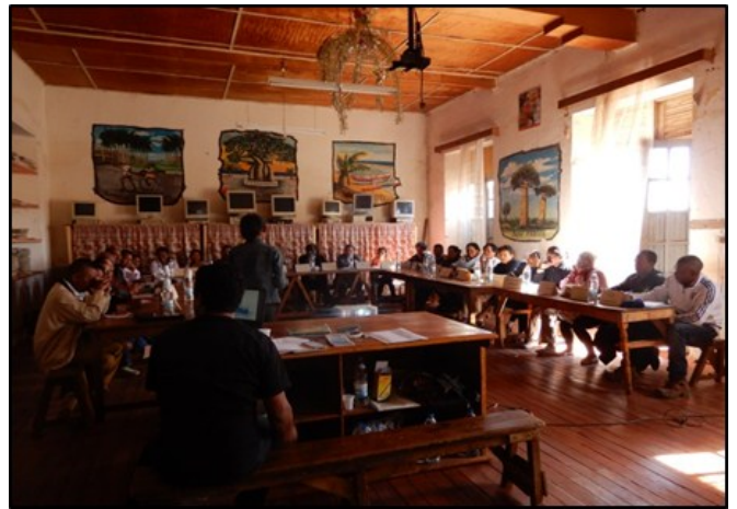
Formations des membres des AUE et des fontainiers