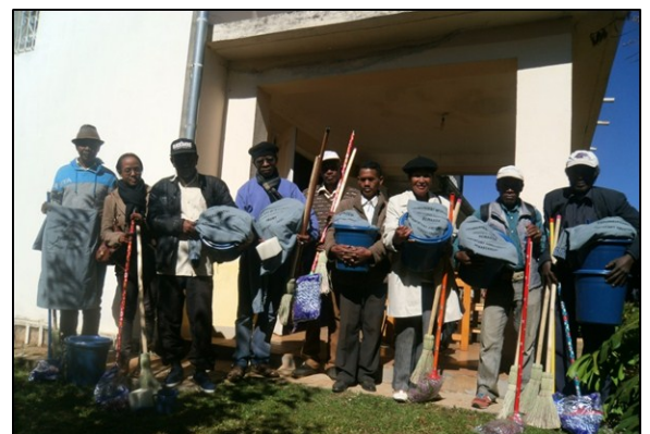
Distribution de matériels aux AUE

En plus des formations, les AUE ont également été équipés en matériels (balais, seaux, tabliers de travail...). Ce « coup de pouce » permettra d'assurer le bon entretien des bornes fontaines au moment de leur prise en main par les gestionnaires. Au fur et à mesure que les ouvrages fonctionneront, les AUE assureront elles-mêmes la mise à disposition de ces matériels.