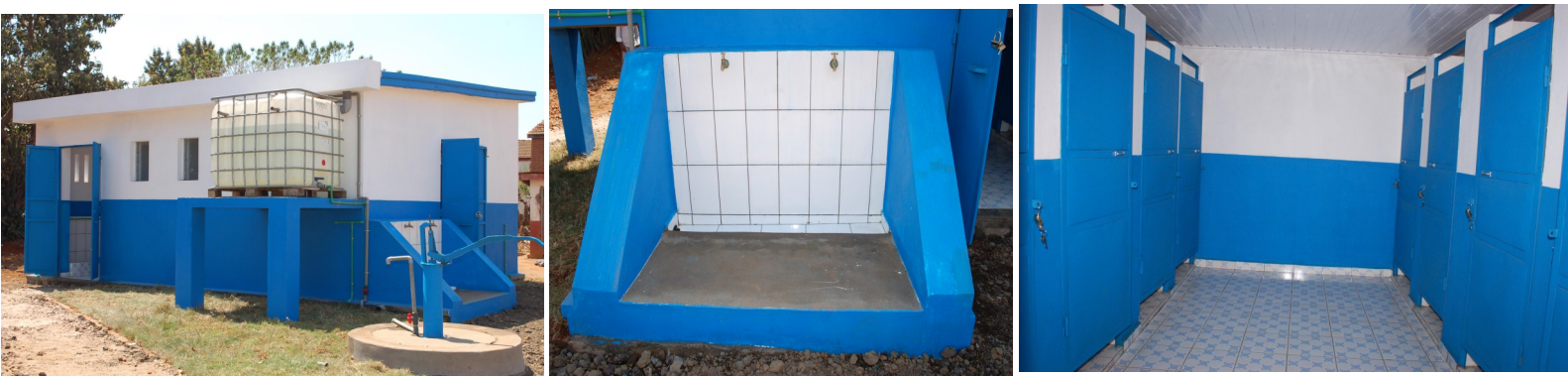
Le nouveau bloc sanitaire de l' EPP Bemasoandro-Ambalakisoa