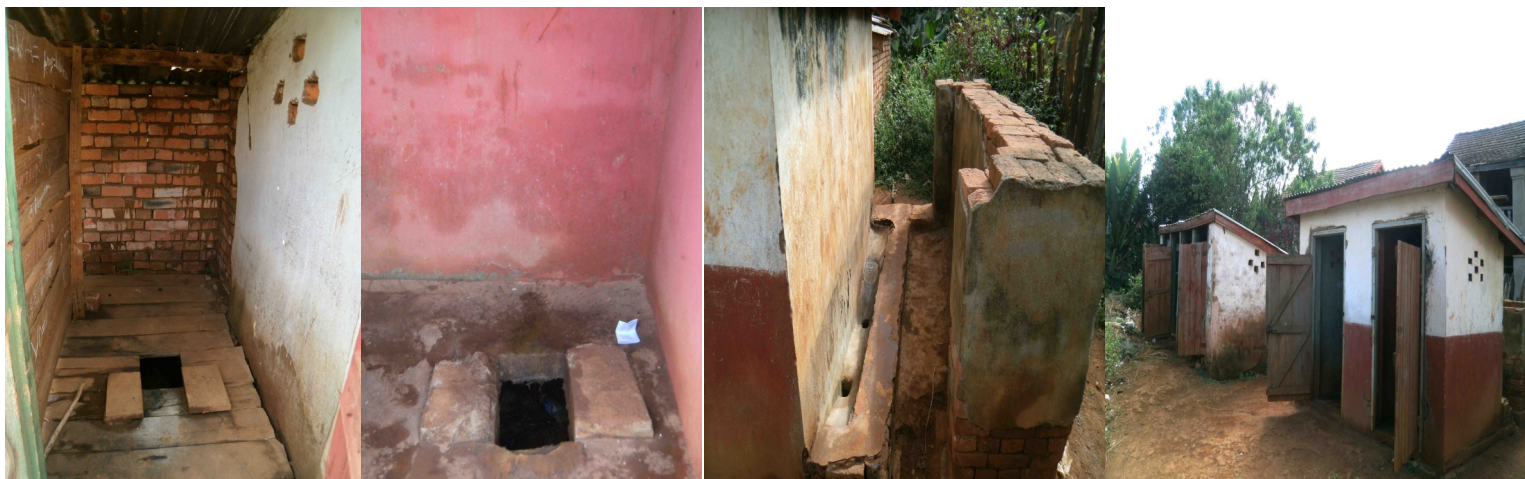
Latrines de l'EPP Bemasoandro-Ambalakisoa à réhabiliter (AVANT)

En avril, une descente terrain a été effectuée avec EAST et le CISCO Antsirabe I sur sept EPP situées dans les zones d'interventions de EAST. Au final, les EPP de Bemasoandro et celle d'Ivory se sont avérées être les plus pertinentes à réhabiliter. Les travaux ont commencés au mois de Juillet et seront terminés mi-Septembre.