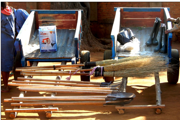
Matériels et équipements dotés à la structure FAMAFA Ivory

La structure a débuté ses activités le jour-même.