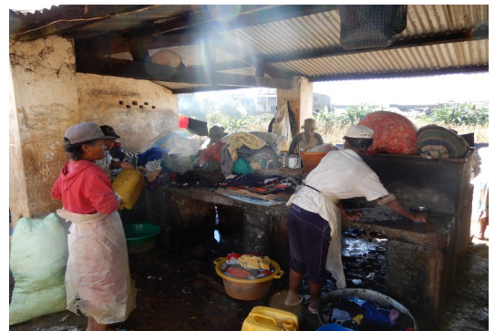
Bassin lavoir d'Atsimotsena à réhabiliter

Quant aux bacs de collecte des ordures, les descentes sur terrains ont permis d'identifier deux nouvelles constructions dans les Fokontany d'Ivory et d'Ampatana et deux réhabilitations à Atsimotsena et Ivory. Le lancement se fera en parallèle avec les deux ouvrages cités ci-dessus.