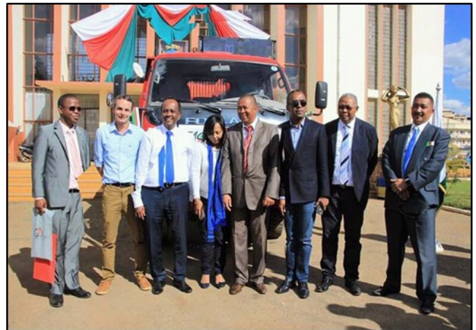
Autorités présentes lors de la cérémonie