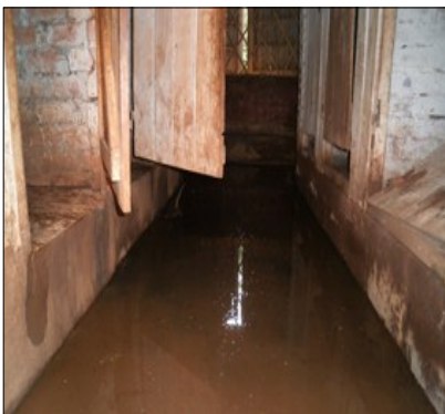
Bloc sanitaire de l'EPP Ivory à réhabiliter (AVANT)