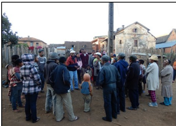
Organisation d'une assemblée générale des habitants (Secteur d'Ivory Centre)

Au cours du mois de mai 2017, des réunions d'informations préalables avec les comités du Fokontany d'Ivory ont été organisées pour collecter des informations et présenter la structure et les actions à entreprendre. Ont ensuite été réalisées des enquêtes auprès des ménages afin d'estimer la participation mensuelle de chaque foyer et la vision des habitants sur la pérennisation de la structure. Le mois suivant, le Conseil Municipal de la ville a délivré l'Arrêté N° Lna-011-17/CM/CU/ABE portant sur la validation et mise en place de la structure. Au mois de Juillet, EAST et le comité du Fokontany d'Ivory ont organisé des assemblées générales pour présenter la structure aux habitants. Les membres du comité de gestion de la structure et les agents qui vont effectuer les travaux de nettoyages et d'assainissements ainsi que les collectes des ordures et les prélèvements des cotisations mensuelles auprès des ménages ont par ailleurs été identifiés. Dans le but d'assurer la pérennisation de la structure, toutes ces personnes ont été formées par les équipes de EAST, notamment sur la gestion financière et l'organisation des activités.