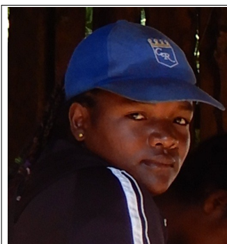
Riveraine Fokontany Atsimotsena:

Nous souhaitons la continuité de la collaboration avec l'ONG EAST, pour de nouvelles constructions d'infrastructures communautaires dans le Fokontany Atsimotsena et dans la ville d'Antsirabe. »