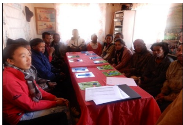
Formation des membres du comité de gestion FAMAFA