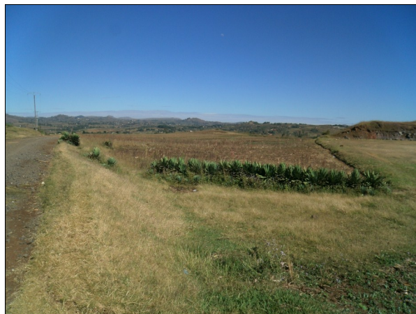
Terrain d'implantation de la future station à Ivohitra

Il est aussi prévu que EAST intervienne dans la valorisation du biogaz issus des fosses septiques des latrines publiques au sein du marché de Sabotsy. Les études devront commencer au cours du dernier trimestre de cette année. Le biogaz sera utilisé pour des activités génératrices de revenus supplémentaires pour ce marché, qui est l'un des plus grands en Afrique.