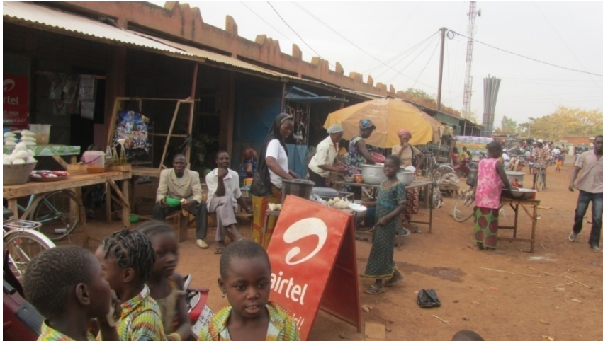
20 boutiques près du marché