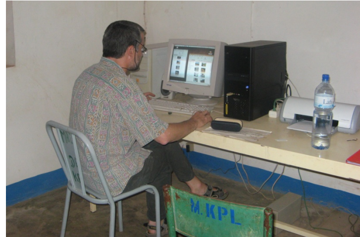
Installation de la connexion internet 2009