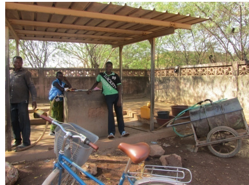
Borne fontaine au centre ville

L'Etat confie la gestion de l'eau et de l'assainissement dans les centres structurés de plus de 10 000 habitants à L'ONEA