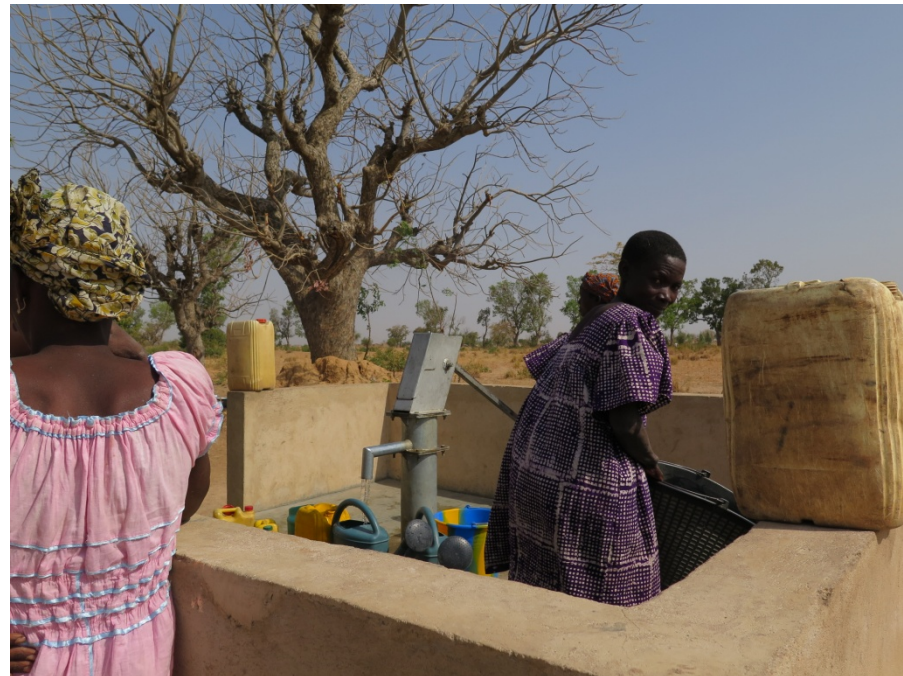
Pompe à motricité humaine dans un village

Dans les quartiers non lotis et les villages, la gestion de l'eau potable et de l'assainissement revient à la commune