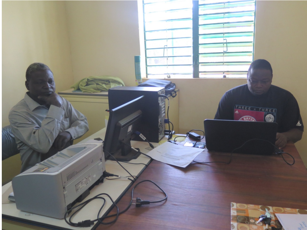
Bureau du service de l'eau et de l'assainissement à la mairie de Koupéla

Recrutement et formation du technicien Equipement du service