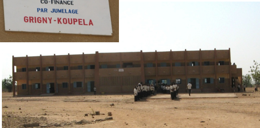
Ecoles et bâtiments scolaires