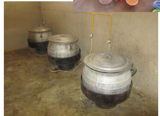
Cantines dans 3 écoles