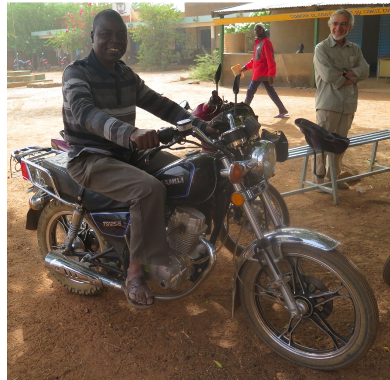
La moto du service pour les tournées dans les villages

Recrutement et formation du technicien Equipement du service