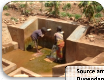
Source aménagée, commune Bugendana, province Gitega,