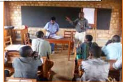
Formation des associations locales, Gitega

AVEDEC a également formé 20 maçons sur les différentes techniques de constructions d'ouvrages hydrauliques et sanitaires dans un objectif de rendre disponible une équipe locale pour les activités de maintenance des ouvrages mis en place.