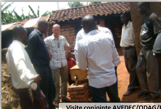
Visite conjointe AVEDEC/ODAG/Protos

Partenaires privés : Donateurs privés Suisses, Allemands et Français, Organismes étrangers : InterAgir, Paroisse Catholique de Prilly, COFORWA,