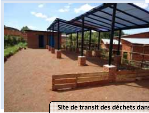
Site de transit des déchets dans la ville de Gitega