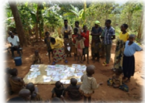
Sensibilisation de la population par un animateur d'AVEDEC, commune de Bugendana

Des séances de sensibilisation sont souvent organisées où ces animateurs échangent avec la population sur comment améliorer les conditions de vie par l'adoption de bonnes pratiques d'hygiène et d'assainissement.