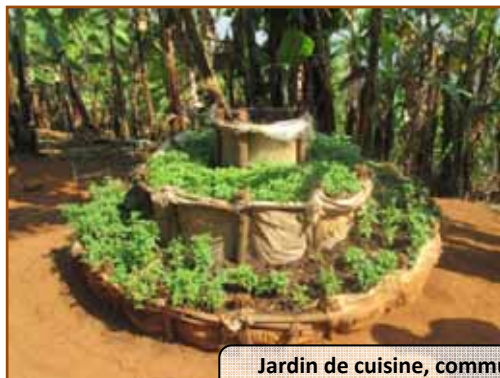
Jardin de cuisine, commune Bugendana