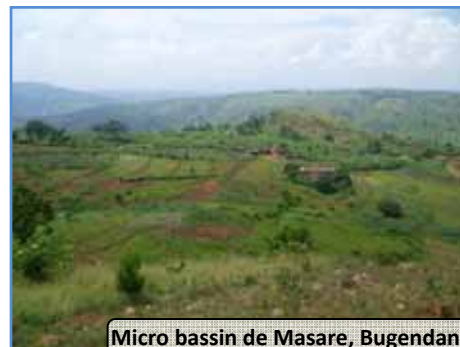
Micro bassin de Masare, Bugendana

La méthode GIRE nous sert d'outil et de guide dans toutes les phases de réalisation de projets.