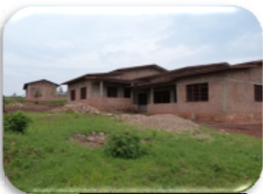
Centre de formation