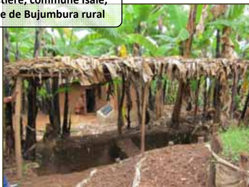
Compostière, commune Isale, province de Bujumbura rural

AVEDEC est particulièrement satisfaite des expériences acquises dans la mise en œuvre du projet AMIASZI ( Aménagement des Marais et Intégration Agro-sylvo-Zootechnique ) à Isale, Bujumbura rural. L'aménagement de 350 ha de bassins versants et le reboisement de 90 ha contribueront significativement à la protection des terres cultivables et à la réduction de la vitesse des cours d'eau qui peuvent menacer la ville de Bujumbura