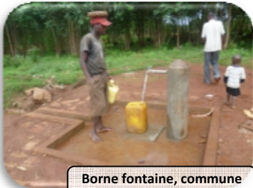
Borne fontaine, commune Bugendana, province Gitega

L' aménagement des sources représente une grande activité d'AVEDEC : les activités d'analyse bactériologique de l'eau permettent d'assurer la potabilité de l'eau, ces sources une fois aménagées desservent la population avoisinante.