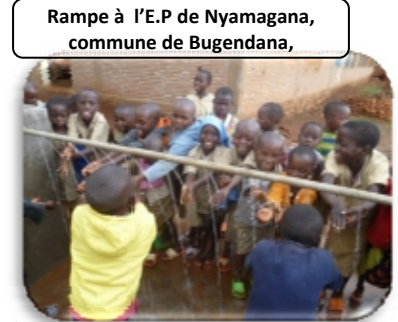
Rampe à l'E.P de Nyamagana, commune de Bugendana,

La construction d'un Centre de Formation pour la Promotion de l'Hygiène et de l'Assainissement ( CFPHA ), reste d'importance capitale pour l'amélioration de la santé de la population burundaise.