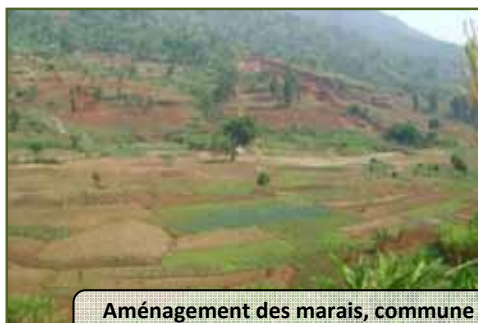
Aménagement des marais, commune Isale, province Bujumbura rural

AVEDEC est particulièrement satisfaite des expériences acquises dans la mise en œuvre du projet AMIASZI ( Aménagement des Marais et Intégration Agro-sylvo-Zootechnique ) à Isale, Bujumbura rural. L'aménagement de 350 ha de bassins versants et le reboisement de 90 ha contribueront significativement à la protection des terres cultivables et à la réduction de la vitesse des cours d'eau qui peuvent menacer la ville de Bujumbura