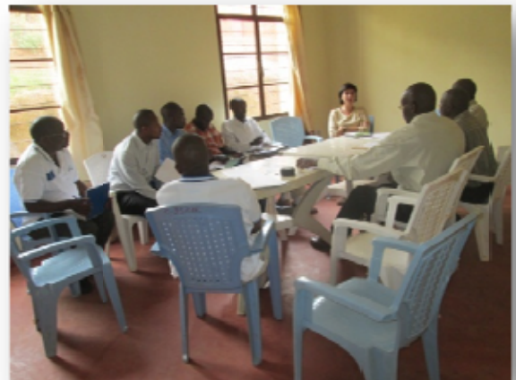
Réunion de travail avec Protos