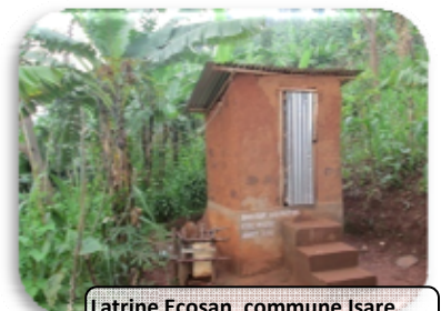
Latrine Ecosan, commune Isare, province Bujumbura rural,