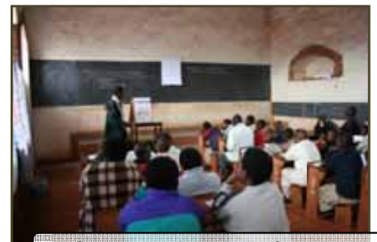
Renforcement des capacités, Bugendana