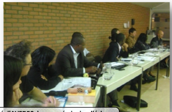
Un délégué d'AVEDEC dans un séminaire d'échange international en Belgique.