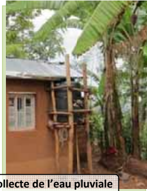
Système de collecte de l'eau pluviale