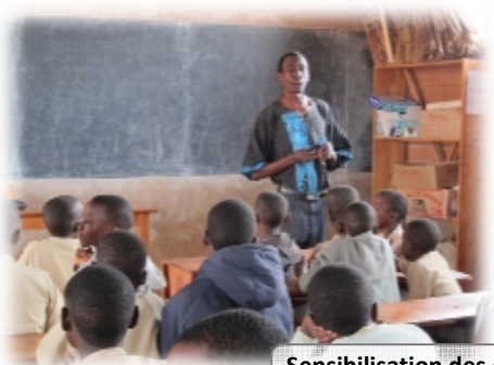
Sensibilisation des élèves avec l'approche child to child

AVEDEC a mis également l'accent sur la promotion de l'hygiène et de l'assainissement au niveau des partenaires locaux. Les approches PHAST (Participatory Hygiene And Sanitation Transformation) et Enfant formateur (child to child) ont été utilisées comme outils de sensibilisation pour le changement de comportement dans les ménages et dans les écoles.