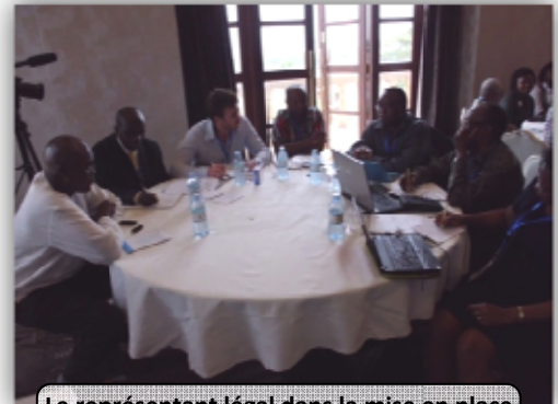
Le représentant légal dans la mise en place d'un réseau WASH au Burundi