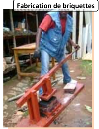
Fabrication de briquettes