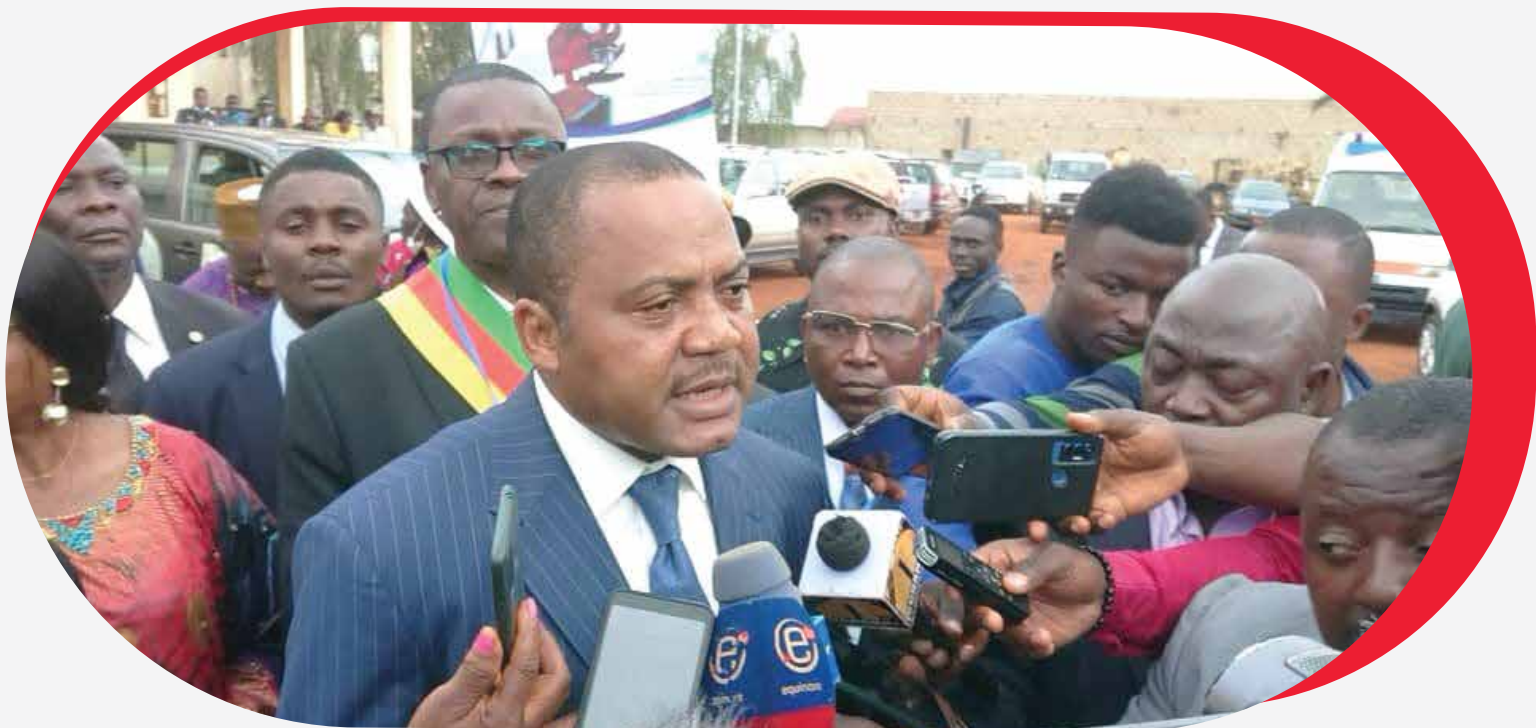
Le Secrétaire Général face à la presse