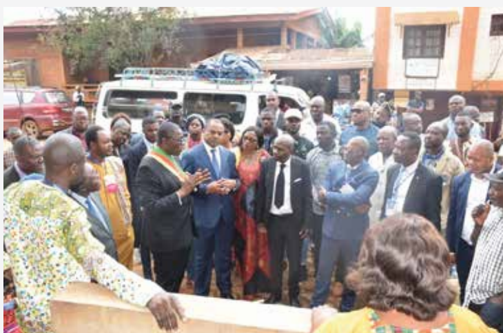
Le Maire de la Commune de Dschang présentant aux participants le principe de fonctionnement de l'AEP et de la borne fontaine