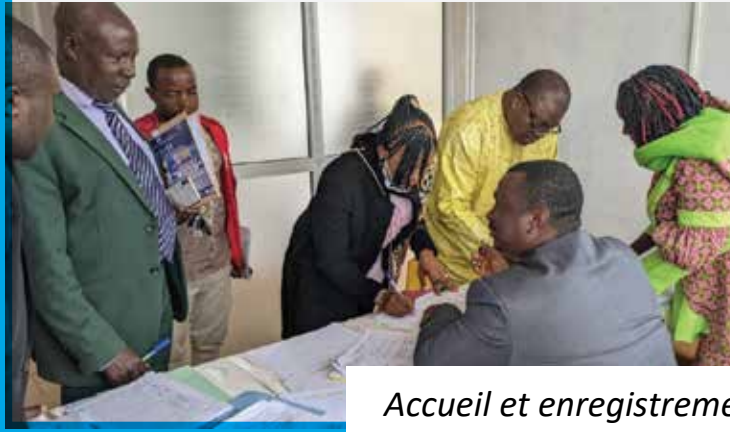
Accueil et enregistrement des participants