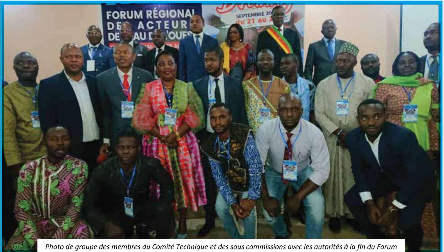
Photo de groupe des membres du Comité Technique et des sous commissions avec les autorités à la fin du Forum

Les activités de préparation se sont terminées la veille du Forum à travers la mise en place des stands et la disposition de la salle de conférence.