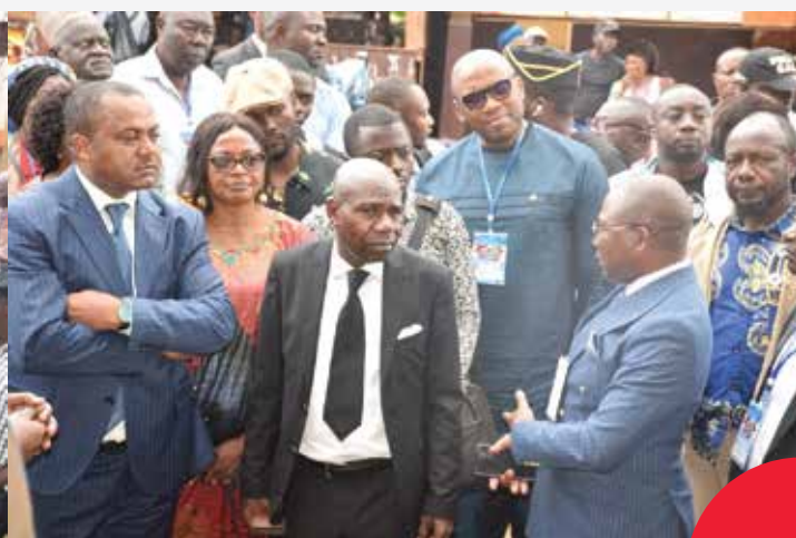
Le délégué Régional de l'eau de l'Ouest expliquant le principe de l'intervention du MINEE auprès des CTD