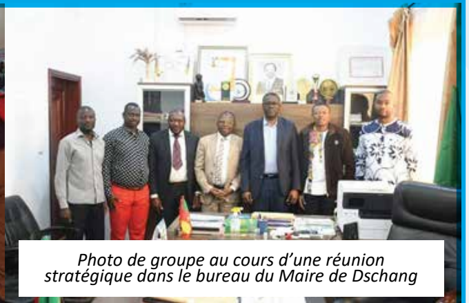
Photo de groupe au cours d'une réunion stratégique dans le bureau du Maire de Dschang