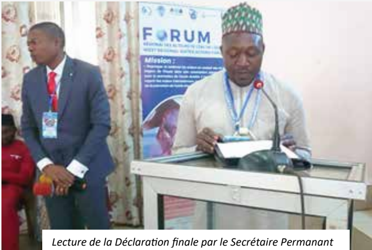
Lecture de la Déclaration finale par le Secrétaire Permanent

Cette phase qui s'est déroulée à bâtons rompus a consisté en un jeu de Questions-Réponses et à des observations ayant abouti à des recommandations qui vont servir d'ossature de la déclaration finale de Dschang. La lecture de la déclaration finale du forum, jointe en annexe a été faite par le Coordonnateur du réseau AME et validée par tous les participants et participantes