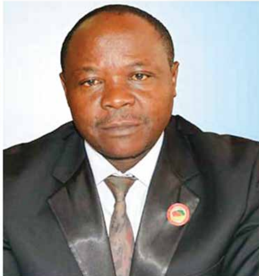
Pr Emile Temgoua : « Il faut permettre à chaque commune ou groupe de communes de réaliser des ouvrages conséquents ».

Dans un contexte où l'eau, entendue comme bien économique se raréfie, quelles mesures prendre pour améliorer l'approvisionnement des ménages ?