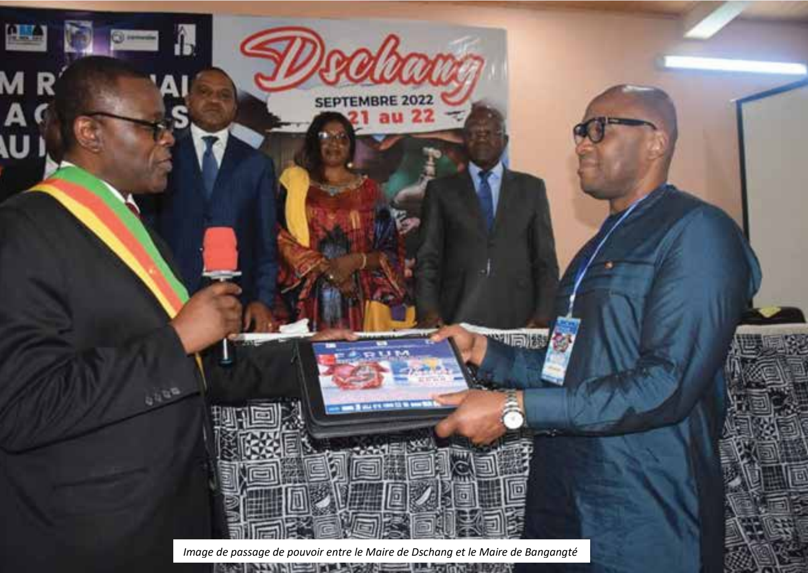
Image de passage de pouvoir entre le Maire de Dschang et le Maire de Bangangté

Avant de mettre définitivement un terme à la première édition du Forum, le Secrétaire Général, présidant les travaux va donner l'opportunité aux Communes de se proposer à accueillir la seconde édition. La proposition du Maire de la Commune de Bangangté va être unanimement acceptée et acclamée par l'ensemble des participants et participantes. A cet effet, le Secrétaire Général va prier le Maire de la Commune de Dschang de passer le flambeau au Maire de la Commune de Bangangté dont le territoire accueillera la seconde édition du Forum en septembre 2023.