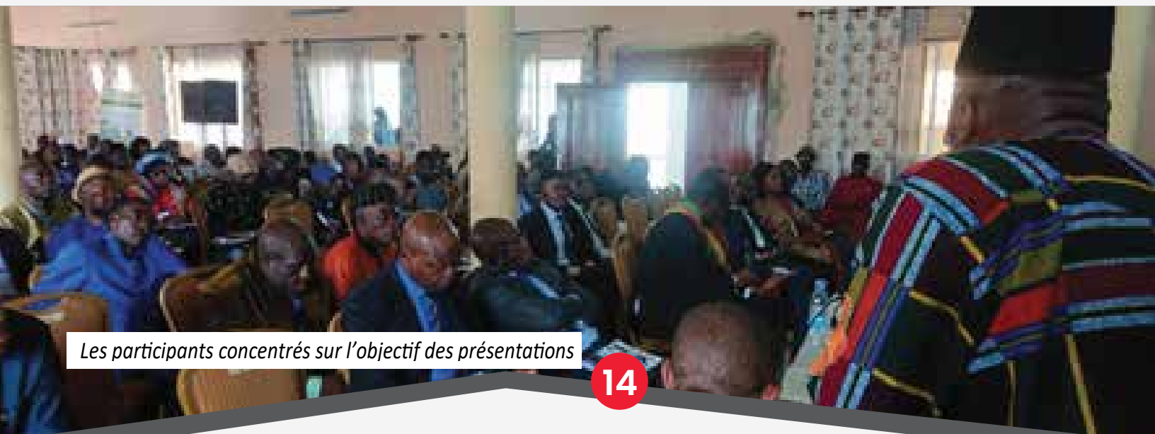
Les participants concentrés sur l'objectif des présentations

Il note que les Monts Bamboutos offrent un cadre privilégié pour l'appréciation des modes de gestion intégrée des ressources naturelles. Ils ont connu en effet durant ces dernières décennies de profondes mutations dont la mise en œuvre soulève d'importants enjeux environnementaux. Il s'agit entre autres de l'intensification des cultures maraichères et vivrières et d'une population galopante. Ces monts sont édifiés sur une dizaine de Communes dont le partage des modes de Gestion Intégrée des Ressources en Eau peut servir à la confection d'un modèle global de gouvernance de l'eau dans la Région de l'Ouest.