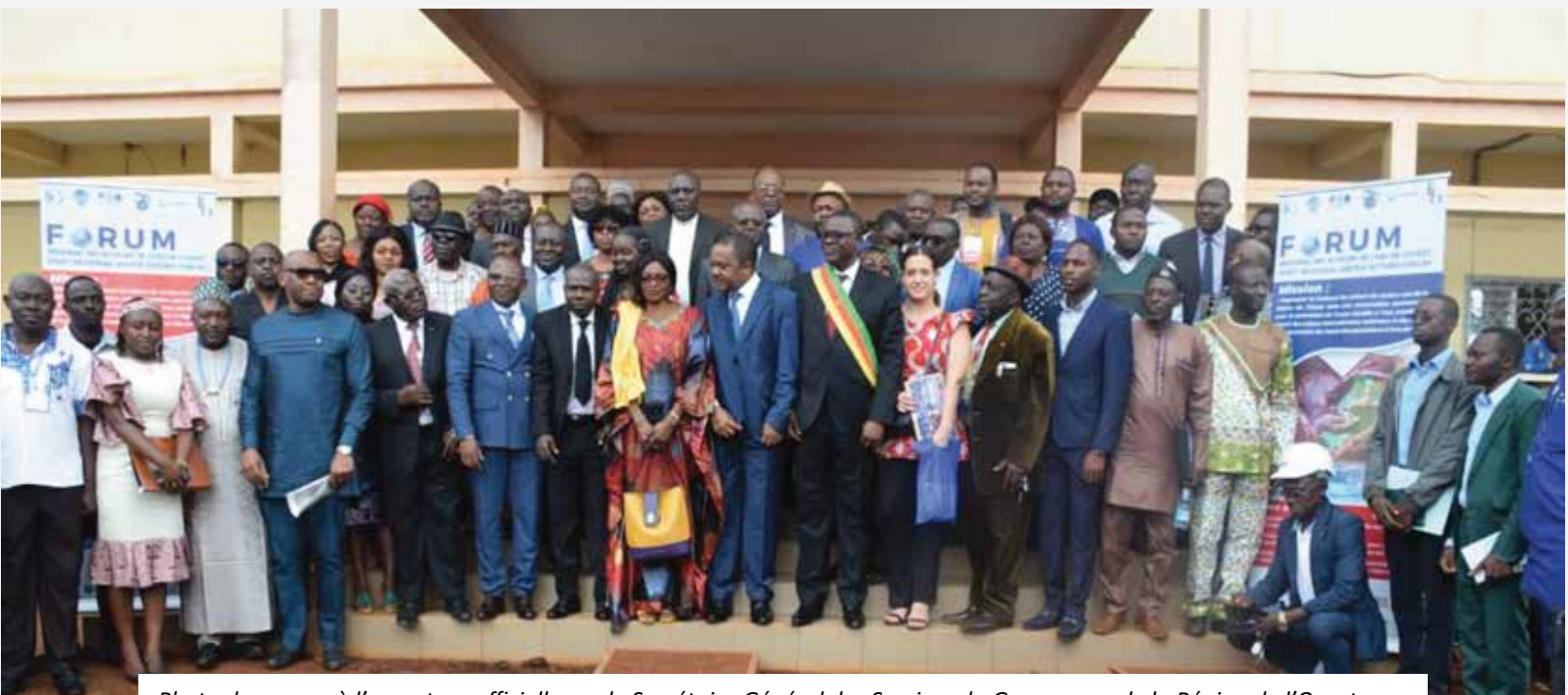
Photo de groupe à l'ouverture officielle par le Secrétaire Général des Services du Gouverneur de la Région de l'Ouest

AME : Alliance pour la Maitrise de l'Eau et de l'Energie ASEAF : Projet d'Amélioration de l'accès à l'Eau et à l'Assainissement dans la Commune de Fokoué ASROC : Association des Raffineurs des Oléagineux du Cameroun CCAG : Cahier des Clauses Administratives Générales CCTP : Cahier des Clauses Techniques Particulières CAMWATER : Cameroon Water Utilities CRTV : Cameroon Radio and Television CTD : Collectivités Territoriales Décentralisées DAO : Dossier d'Appel d'Offre FEICOM : Fonds d'Equipement Inter Communal IDIMAG : Initiative de Dialogue Multi-Acteurs pour la Gouvernance de l'Eau MINEE : Ministère de l'Eau et de l'Energie ODD : Objectif de Développement Durable ONG : Organisation Non Gouvernementale OSC : Organisation de la Société Civile PIGEDEA : Programme Intégré pour la Gestion Durable de l'Eau et Assainissement PUI : Première Urgence Internationale SDE : Service Déconcentré de l'Etat UNICEF : Organisation des Nations Unies pour l'Enfance