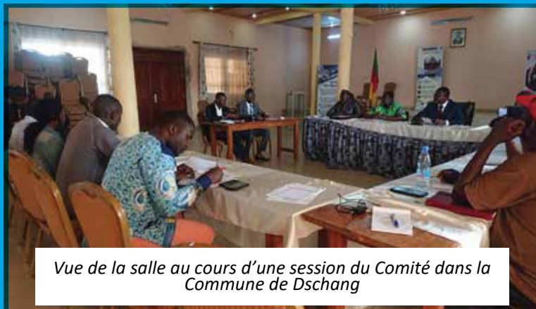
Vue de la salle au cours d'une session du Comité dans la Commune de Dschang