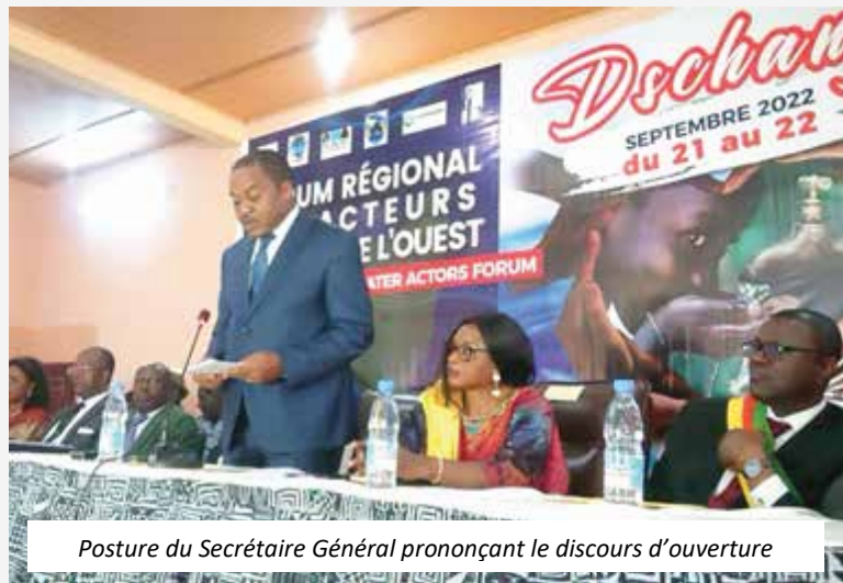
Posture du Secrétaire Général prononçant le discours d'ouverture