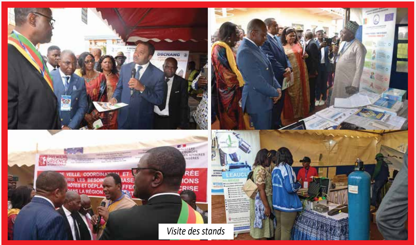
Visite des stands