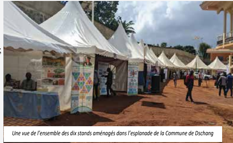
Une vue de l'ensemble des dix stands aménagés dans l'esplanade de la Commune de Dschang

Au niveau de chaque Stand, les responsables présentent aux visiteurs leurs activités et répondent à quelques questions de compréhension. Tous les 10 stands ont été visités.