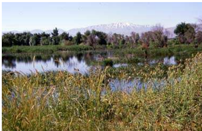
Fig. 2 Vista hacia el oeste a través del humedal de Aammiq.

Históricamente el humedal cubría una gran proporción de la llanura de Bekaa, extendiéndose treinta kilómetros al norte de sus límites actuales. Sin embargo, desde tiempos inmemoriales algunas partes de la llanura han sido convertidas en granjas debido a la elevada fertilidad del suelo. El último gran esfuerzo realizado para drenar el humedal con fines agrícolas ocurrió durante la década de los 60 e inicios de los 70, con la excavación de una extensa red de canales de drenaje a lo largo de la llanura y la construcción de diques alrededor del río Litani para prevenir que el agua del río se desbordara hacia la llanura durante las inundaciones. Estas acciones redujeron el humedal a aproximadamente su tamaño actual. También se excavaron canales dentro del mismo humedal acelerando su desecado durante la temporada seca, aunque éstos han sido cerrados en interés de la conservación. El conflicto entre los intereses de los granjeros locales y de la flora y fauna del humedal es aún la fuente principal de los problemas de agua en la zona.