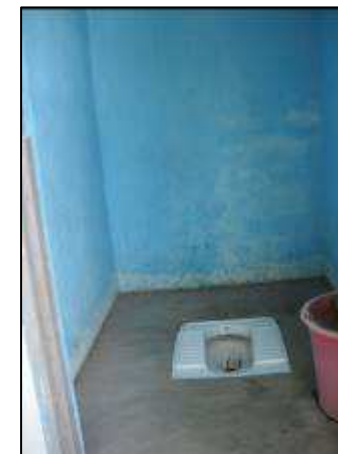
Visite des ouvrages E/A dans la commune rurale d'Antsakoamanondro : borne fontaine clôturée et bien entretenue, wc entretenu