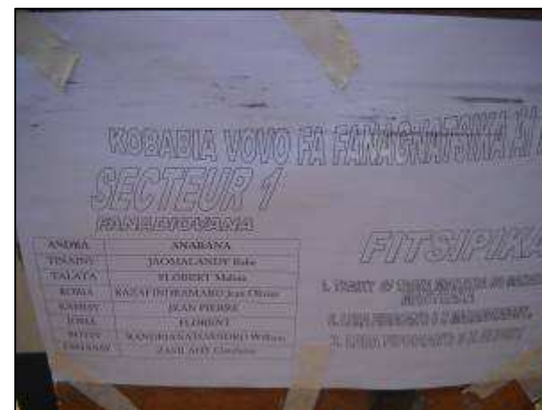
AEPMH dans le Fokontany Ambalavelona : équipée d'une pompe India Mark II, borne fontaine clôturée et bien entretenue, une fiche indiquant le règlement, les horaires d'ouverture et de fermeture de la BF, avec la liste des personnes responsables de l'entretien journalier est affichée devant le parc (cf. ci-dessus).