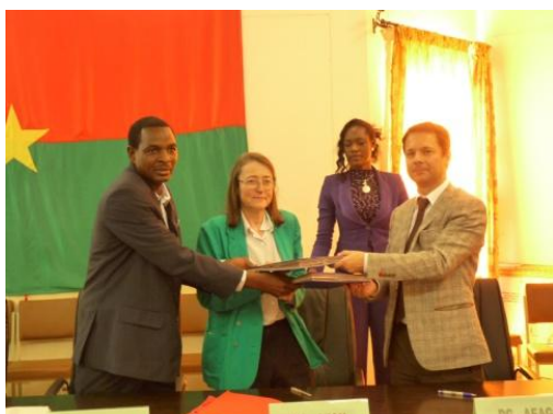
Signature du protocole d'accord de coopération entre les Agences de l'Eau Adour-Garonne et Seine-Normandie et l'Agence de l'Eau du Mouhoun.

Le 27 novembre 2013, en présence de Mme le Ministre de l'eau, des aménagements hydrauliques et de l'assainissement, les deux agences de l'eau françaises Seine-Normandie et Adour-Garonne et l'agence de l'eau du Mouhoun, ont signé un protocole d'accord afin d'accompagner cette dernière dans sa démarche de gestion intégrée des ressources en eau, à travers le développement de méthodologies et d'outils pour renforcer la gestion des ressources en eau du bassin du Mouhoun.