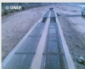
Système de prétraitement de la station de Taourirt-Maroc, de type anaérobie/facultatif/maturation.