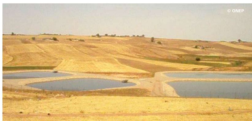
Station de Ben Ahmed au Maroc de type anaérobie/facultatif.

Le traitement par lagunage est constitué d'une série de bassins artificiels, ou étangs, formés de digues, imperméabilisés, dans lesquels les eaux usées sont déversées [1] et passent successivement et naturellement d'un bassin à l'autre, par gravitation [3], pendant un long temps de séjour. Différents assemblages de ces bassins sont possibles en fonction de divers paramètres, tels que les conditions locales, les exigences sur la qualité de l'effluent final et le débit à traiter [1]. Ces bassins fonctionnent comme des écosystèmes avec des relations de symbiose entre les différentes populations composées de bactéries, de champignons, de protozoaires, de métazoaires, d'algues, de poissons, de plantes, etc. [4]. Ces différents organismes interviennent afin d'éliminer la charge polluante contenue dans l'eau usée [3].