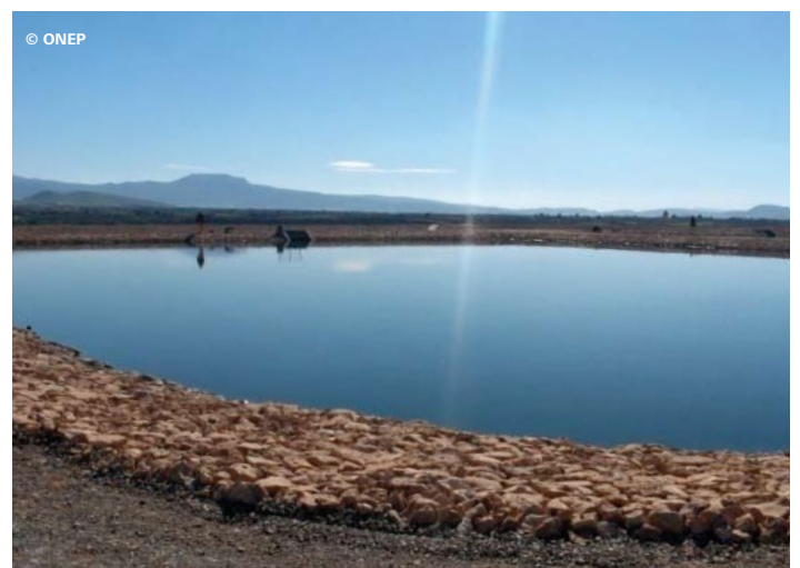
Bassin anaérobie de la station de Berkane au Maroc.

Les étangs anaérobies permettent de stabiliser les boues [10], en plus de traiter l'eau usée. Ils reçoivent des charges de pollution relativement élevées, qui sont exprimées en Demande