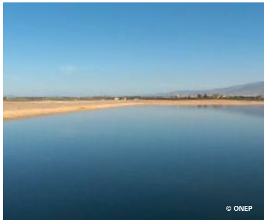
Bassin facultatif de la station de Berkane au Maroc.

Les étangs facultatifs correspondent à des lagunes où il se développe une relation symbiotique entre les divers microorganismes aquatiques, en particulier les algues et les bactéries hétérotrophes [10]. Ce sont de simples bassins creusés en terre, de grande dimension, mais dont la profondeur ne doit pas dépasser 1 à 2 m afin de préserver les conditions d'aérobiose à la surface [1, 2, 11]. La charge de pollution entrante ne doit pas être trop élevée [1]. Les matières dissoutes et colloïdales sont oxydées par des bactéries aérobies ou facultatives, utilisant l'oxygène provenant de l'absorption naturelle et l'oxygène produit par les algues, qui se développent dans la couche superficielle [10]. Les matières décantables sédimentent pour former des boues, qui entrent dans la décomposition anaérobie, avec production de méthane et d'autres composés réduits. Ces derniers migrent vers la couche aérobie où ils sont oxydés [2]. Le gaz carbonique résultant de l'oxydation des matières organiques sert de source de carbone pour les algues [10].