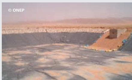
Bassin de la station de Bouarfa-Maroc, de type anaérobie, étanché par une géomembrane.